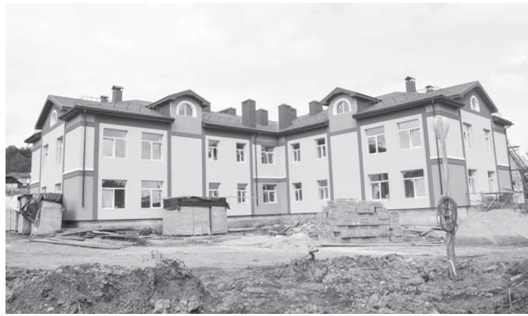
Дитсадок у Чорнолізцях

– Повідомлення є, але питання в тому, для чого піднімати платіж до Ки-