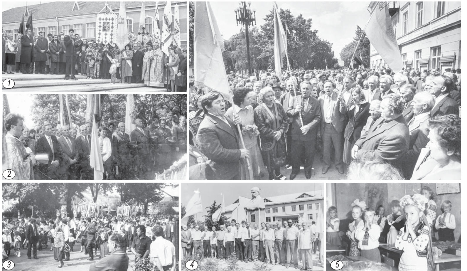
1 – Відкриття пам'ятника Тарасові Шевченкові в Тисмениці. 18 жовтня 1992 року. 2 – Відправа на могилі Василя Сусяка в Підпечарах. Липень 1992 року. 3 – Перше вересня в Єзуполі. 1990 рік.

У зв'язку з відпусткою колективу редакції наступний наш номер вийде 10 вересня.