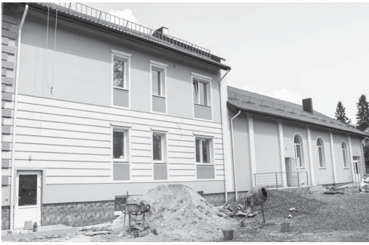
На завершенні будівництво Народного дому в Пшеничниках