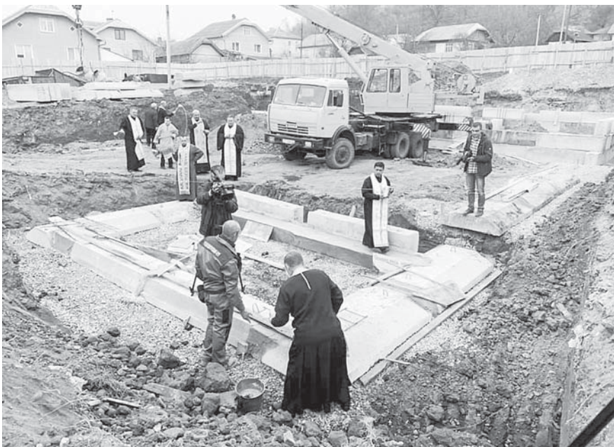
Освячення наріжного каменя будови дитсадку 28 жовтня 2019 р.

що в рідному селі робиш як для себе. Це неписане правило діє майже повсюдно. Звичайно, для якихось спеціальних робіт залучають фахівців вузького профілю. За словами депутата обласної ради В. Гла-