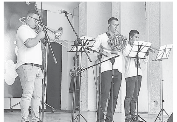
Опісля концерту відбувся показ фільму «Гуцулка Ксеня».