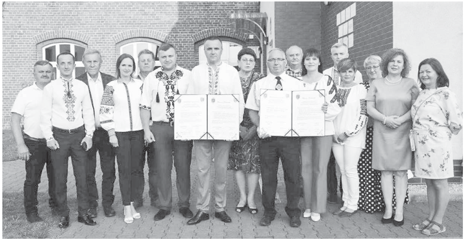
У руках представників делегації – угода між селом Павлівка Ямницької громади та Добровільною пожежною частиною села Гродзисько (гміна Стшельце Опольське)

Із діловим візитом побували нещодавно у Польщі представники двох громад колишнього Тисменицького району – Тисменицької міської та Ямницької сільської.