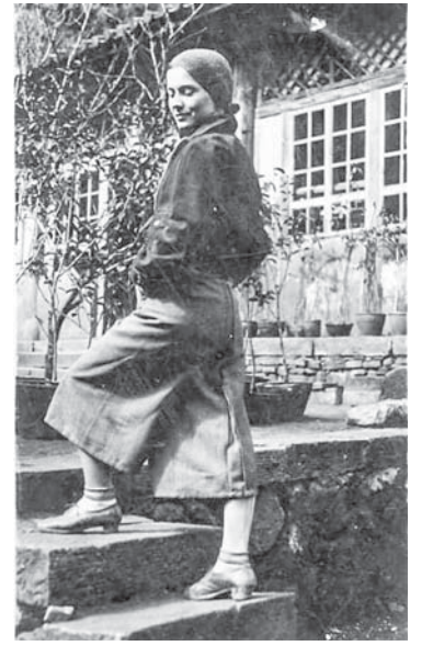
Фото Софії Яблонської – із сторінки проекту «Родовід»

«З країни ризику та опії», «Далекі обрії» «Чар Марока» – книжки нарисів з