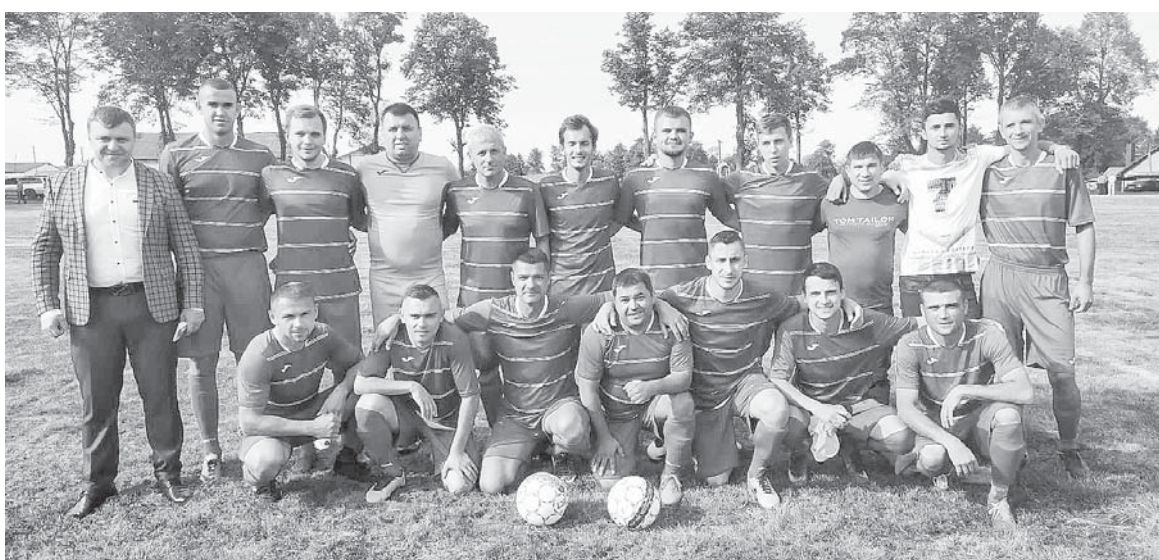
«Сокіл» Павлівка – переможець першості Тисменицького району з футболу сезону 2020/2021 р.

УВАГА: 4 липня о 14.00 на стадіоні в Ямниці відбудеться фінальна гра Кубка району між командами «Бистриця» Старий Лисець – «Сокіл» Павлівка