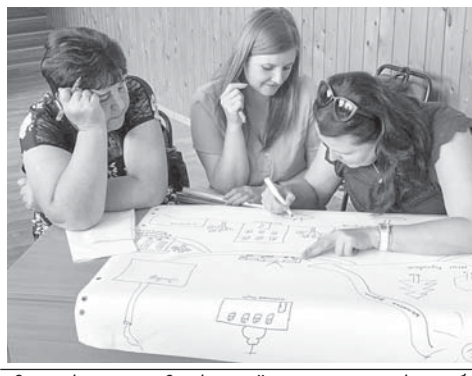
Стратегія розвитку Єзупільської громади у процесі розробки

А окрім активного відпочинку, у громаді днями, разом з експертом розвитку громад, розпочали роботу над написанням дорожньої карти ТГ.