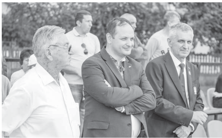
Не скучна гра

І ось, сезон 2020/2021: «Ураган» Чернівці – дебютант чемпіонату, футбольної еліти області, 11 команд, які в ході 22 турів виборювали титул чемпіона. Кожна команда зіграла по 20 матчів. Ось цьогорічний результат «Урагана»: 14 перемог, 6 нічий, 0 (нуль!) поразок, 49 забитих, 11 пропущених м'ячів, 48 очок. Цьогорічний срібний призер «Прикарпаття-Тепловик» з Івано-Франківська здобув 40 очок, бронза з 36 очками за кращим результатом забитих-пропущених дісталася гуцулам з команди «Сокільське» (село Тюдів Косівського району).