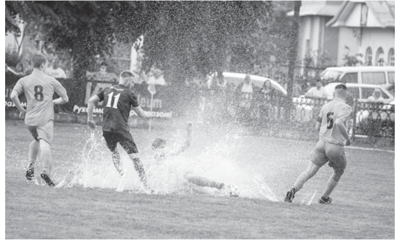
Майже водне поло

Усім необхідним забезпечили також і саму футбольну команду: м'ячі відповідної якості, що теж коштують немало – близько двох тисяч гривень кожен; декілька комплектів