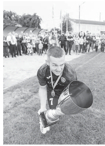
Кубок в «Урагана»

«Івано-Франківська обласна асоціація футболу вітає керівництво, гравців, тренерський штаб і вболівальників