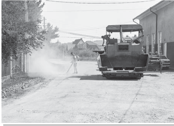
Ремонт дороги в Підлузжі

Уже заасфальтований двома шарами фрагмент дороги в Радчу. У с. Драгомирчанах на вулиці Шкільній зараз ведуться роботи з реконструкції придорожньої канави, яка свого часу була неправильно зроблена, через що дорожнє покриття зсувається в