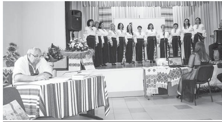
...І натхненний концерт