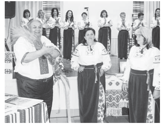
Традиційне підліське перевесло – автору книжки

Відтепер ця книжка займатиме почесне місце на полицях бібліотеки, стане чудовим посібником для проведення уроків краєзнавства, прикрасить книжкові полиці багатьох підліссян і служитиме їм надійним оберегом у збереженні багатой