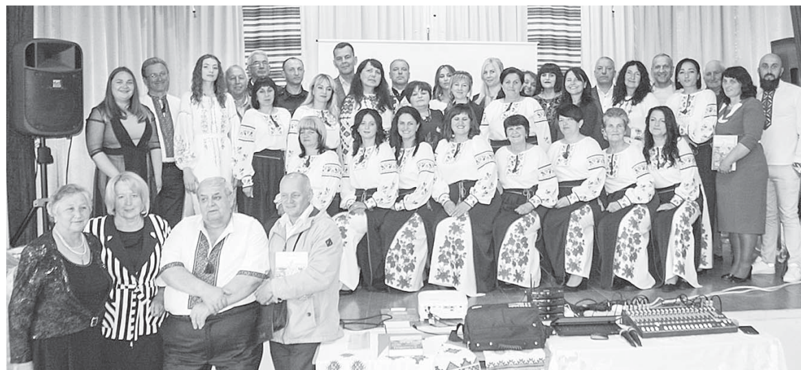
Разом із гостями презентації

За високий професіоналізм, багаторічну сумлінну працю й наставницьке покликання нагороджений Грамотою Міністерства освіти і науки України, нагрудним знаком «Відмінник освіти України» та медаллю «Почесна відзнака» Товариства Червоного Хреста України.