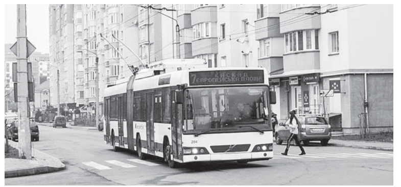
Тролейбус Volvo V 7000 на маршруті

– Треба усвідомити, що громадський транспорт – це дороге задоволення в принципі, будь-де у світі. Інше питання, хто за нього платить. Чому ж тоді у всьому світі він існує? А тому, що без громадського транспорту інфраструктурно жодному місту не справитися. Громадський автотранспорт має на меті розвантажити місто від автомобілів, а електричний робить це розвантаження ще й екологічним. І в усьому світі громадський транспорт – послуга, яку місто замовляє для своїх громадян. І так, це дорого. Якщо весь тягар вартості впаде на пасажирів, він не буде ним користуватися, а пересяде назад у своє авто чи таксі. А далі транспортний колапс. Тож місто оплачує роботу транспортної компанії, а люди платять лише частину вартості проїзду. Покриття таких витрат до 2016 року здійснювала держава, а тепер – винятково органи місцевого самоврядування. Функціонування нашого підприємства місто мусить забезпечити в будь-якому разі. Але треба розуміти, що для нього суттєво дорожче обходиться перевезенням пасажирів із Камінного, ніж в межах самого Франківська. Та оскільки села належать до громади, то з місцевого бюджету мусять бути виділені кошти на ці перевезення і