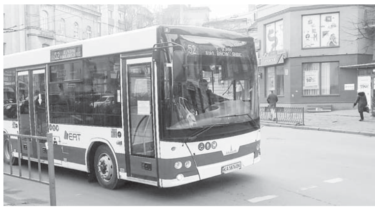
Новенький МАЗ везе узинчан

За словами В. Голутяка, місто надалі планує поповнювати автопарк вітчизняною або турецькою технікою, хоча загалом в Україні на дорогах найбільше білоруських автобусів. Франківці віддають перевагу нашому «Богдану». «Що ж стосується турецьких, – пояснює керівник «ЕАТ», – то це техніка дещо вищої якості і, безперечно і нас і пасажирів це влаштовує. Коли в 2018 з'явилася можливість закупити «Кобри» від