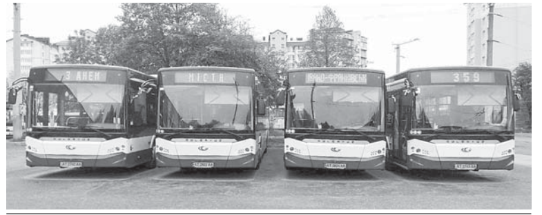
Вітання з днем міста від «Електроавтотранс». На фото – турецькі автобуси

«Громада стала дуже великою. З огляду на це розробили системи так званих «пересадкових вузлів», які ще планують облаштувати, коли автобус доїжджає до периферії міста, як от зупинка «Європейська площа» чи автостанція № 4 (як кажуть «в народі» – «на Угорниках»). Сюди доїжджають автобуси з Добровлян, Колодіївки, Підпечер, Узина, і Підлужжя – ред.). Про створення таких вузлів вирішує міськвиконком. Це значно раціональніше, ніж коли б транспорт їхав до центру міста, – аргументує директор підприємства. – Адаже на маршрутах до сіл МТГ курсують один-два, максимум три автобуси. Якби