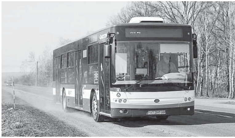
«Богдани» вітчизняні і достатньо комфортні

Мають також чотири білоруські автобуси марки МАЗ на 8,5 метрів.