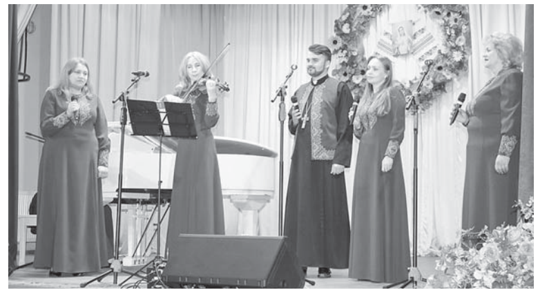
До уваги матерів – виступ ансамблю «Домінанта»

Програма вдалася різноманітною й насиченою. Приємно, що культура громади нарешті отримала можливість продемонструвати свої барви на сцені та що «призвідницями» свята стали чарівні й душевні галицькі матері.