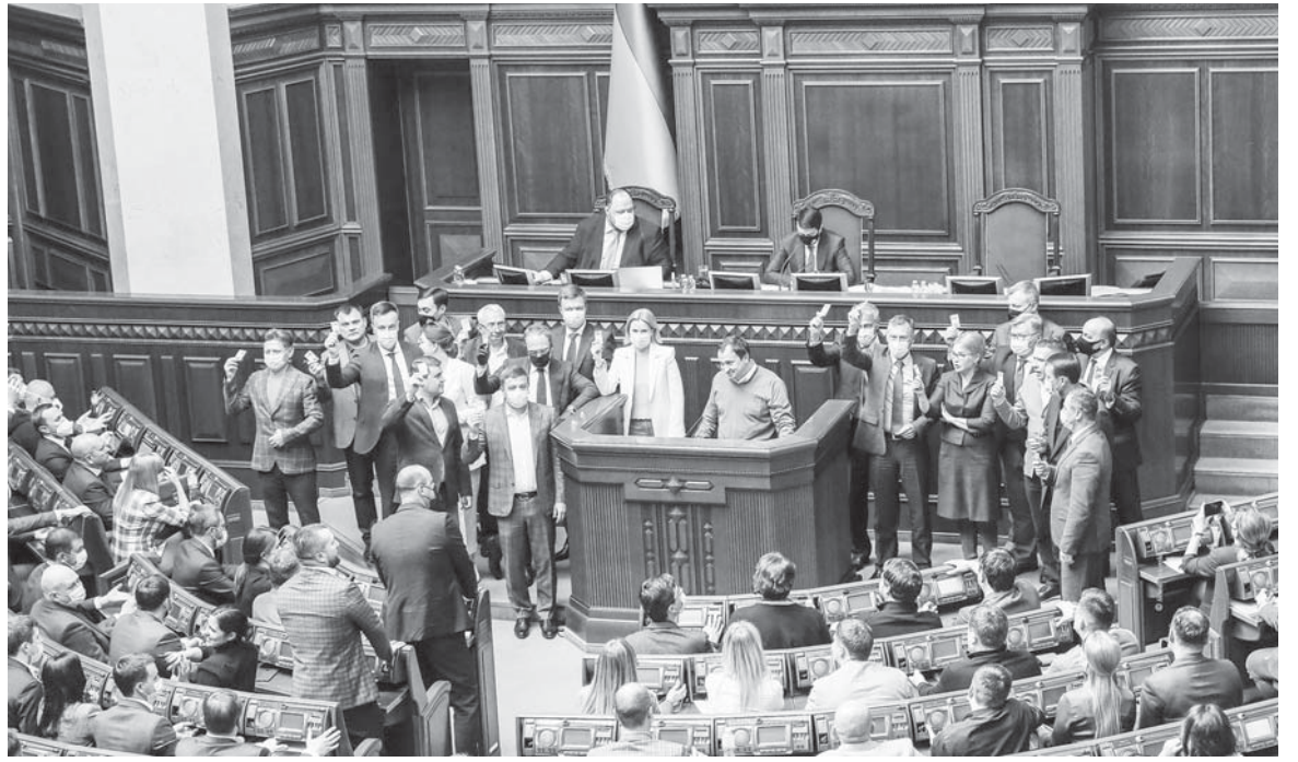
Фракція «Батьківщина» не дала жодного голосу за розпродаж землі

У попередньому варіанті Земельного Кодексу було заборонено знімати верхній шар ґрунтів, бо він формується тисячі років і є національним надбанням. Щойно при-