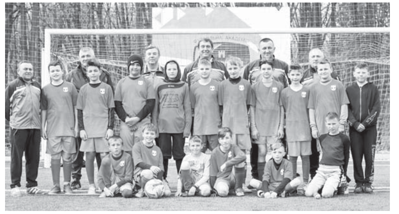
Команда Тисменицької ДЮСШ та її наставники

повернулися вихованці футболу збірної ДЮСШ U-12, які 23 квітня на «Хет-Трик-Арені» поступилися лідеру групи та чи не найсильнішій команді цієї вікової категорії – НФК «Ураган» з рахунком 2:10. А вже 27 квітня юні футболісти Тисменицької ДЮСШ, укомплектовані тисменицькими, старолісецькими, підліськими, павлівськими та поберезькими однолітками не залишили шансів гравцям франківської «Ніки-05-04», забивши у ворота суперника 10 м'ячів, натомість пропустивши один. Після трьох турів Чемпіонату ДЮФЛІФО (обласної ди-