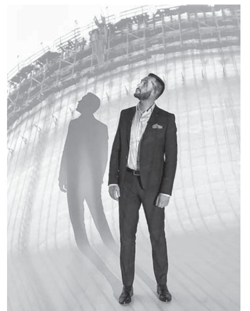
О. Преподобний в ролі вчителя

Коллекційна платівка, в основу кожної композиції якої закладені характерні для чорнобильської зони звуки (тріск дозиметра, скрип оглядового колеса, шум рудого лісу тощо), матиме можливість розширення через додану реальність та мобільний додаток Chornobyl App. Це означає, що при наведенні смартфона на обкладинку, фотокартки артистів будуть оживати й озвучувати свої думки про Чорнобиль та розповідати про враження від поїздки у зону відчуження.