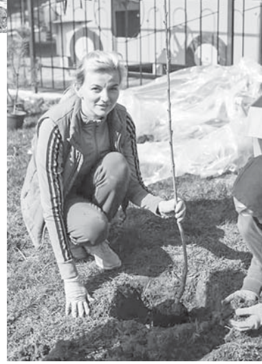
Дерева садять мати...