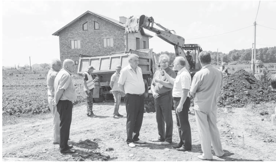
А починалося оптимістично – 1 червня 2017 року

гу до відповідних інстанцій з проханням-вимогою забезпечити продовження розпочато-