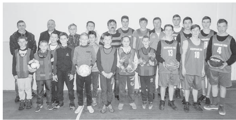
Підліська спортивна зміна