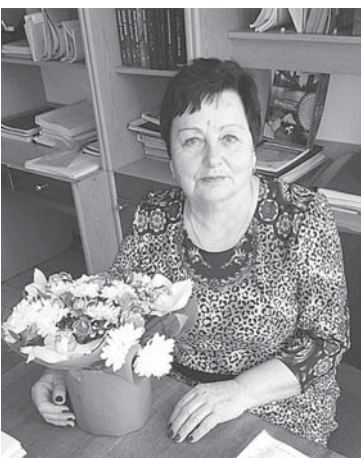
Працівники Довгівського НВК, учні та батьки