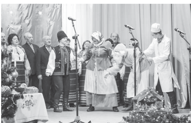
Колоритна Маланка від учасників ансамблю танцю «Тисменичанка»