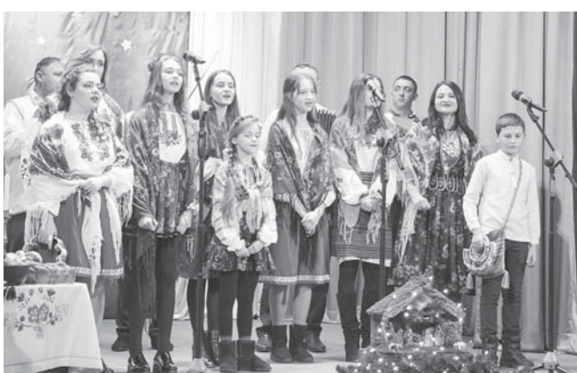
Колядує Старий Лисець