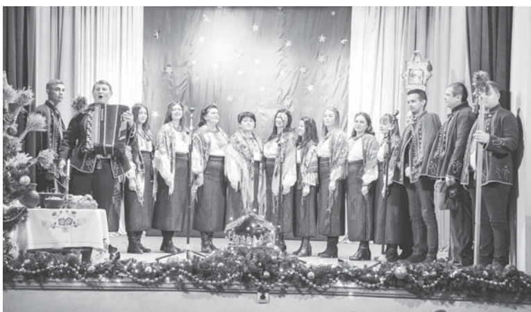
Співає «Братчина», с. Братківці