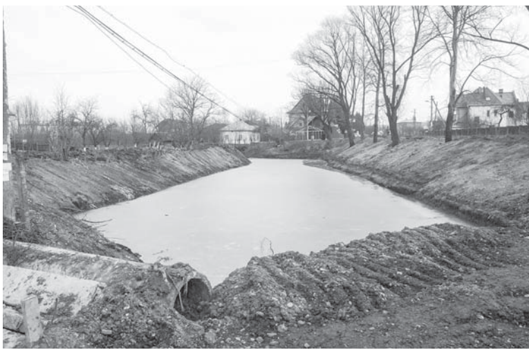
Канал біля «Газбуду» в районі вулиці Мазепи