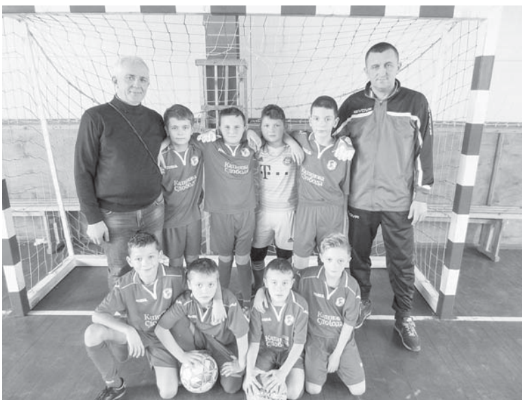
Команда Старого Лісця

Вітаємо фіналістів Шкільного турніру футзалістських команд Тисменицького району на Кубок НФК «Ураган» – команди Угринівського ліцею та Старолісецької загальноосвітньої школи.