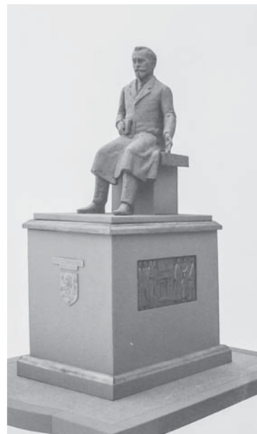
Проект пам'ятника Костю Левицькому

І хоч будівля кляштора датується серединою XVIII ст., сам монастир та костюл споруджені (у дерев'яному варіанті) 1630 року за сприяння польського магната,