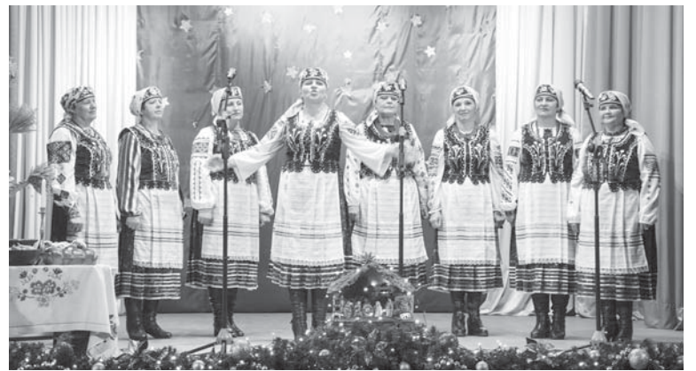
В автентичних строях з лемківськими колядками фольклорний колектив з Тарновиці