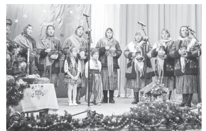
Фольклорний колектив «Вільшанка»