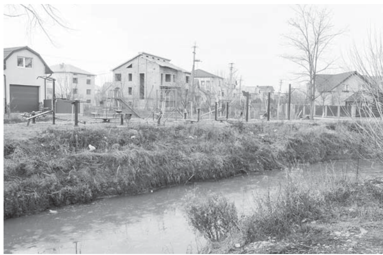
На Набережній – Лесі Українки очищено русло Стримби, встановлено тренажери

наповнювали бюджет. Тож дякую всім тисменичанам, хто творив добрі справи, щоб наше місто стало чистим, затишним, європейським.