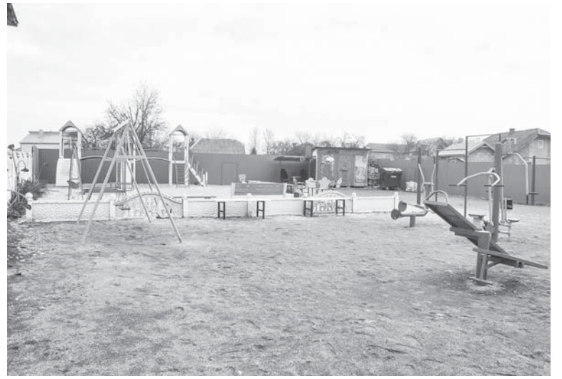
Дитячо-спортивний майданчик по вул. Монастирській