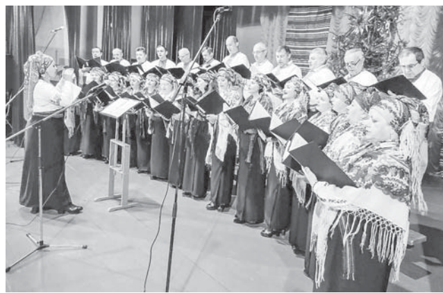
Хор церкви святого Миколая