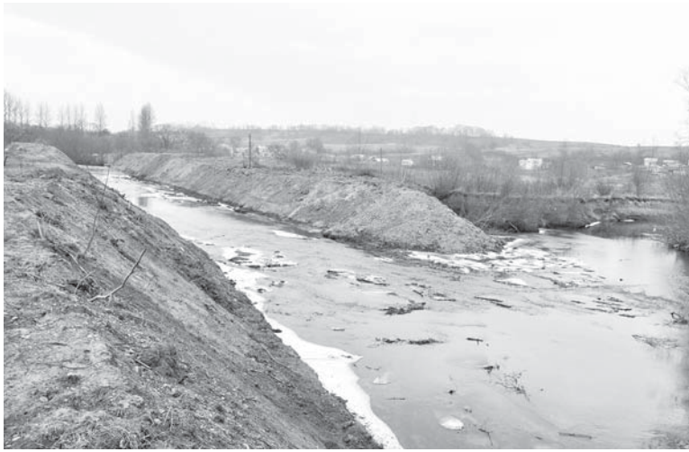
Канал біля «автодрому» не дасть «великій воді» вийти з берегів. Цього року планують зробити також на Слободі