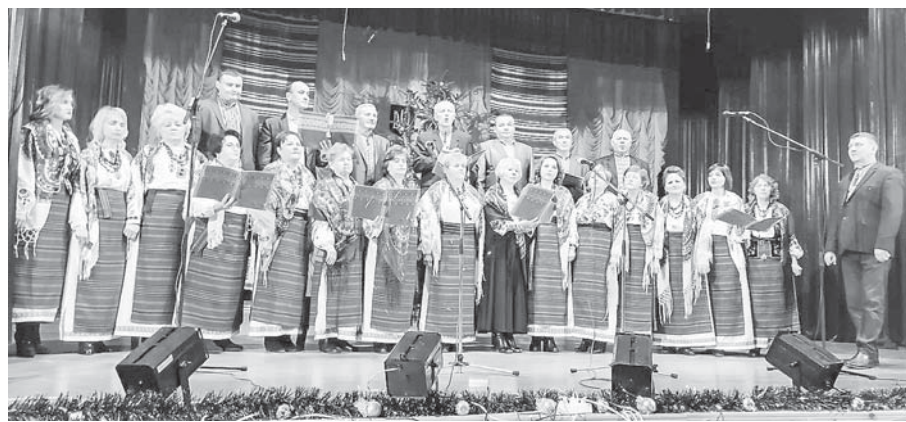
Хор церкви Йосифа Обручника