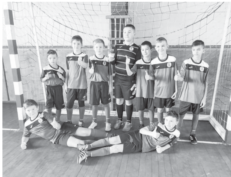
Команда з Угринова