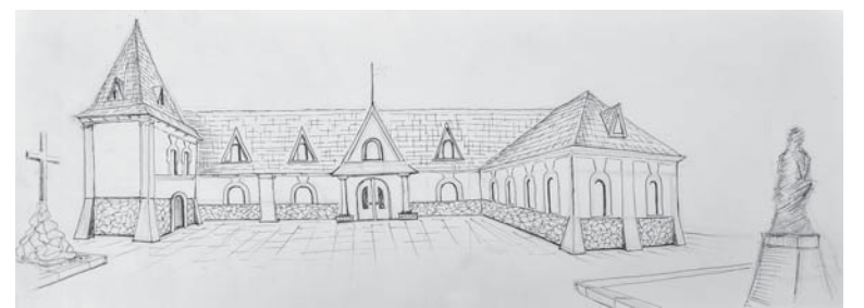
Ескіз реконструкції кляштора

політика та полководця Миколи Потоцького та його дружини Софії.