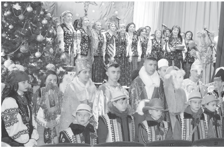
Народний аматорський хор «Просвіта»