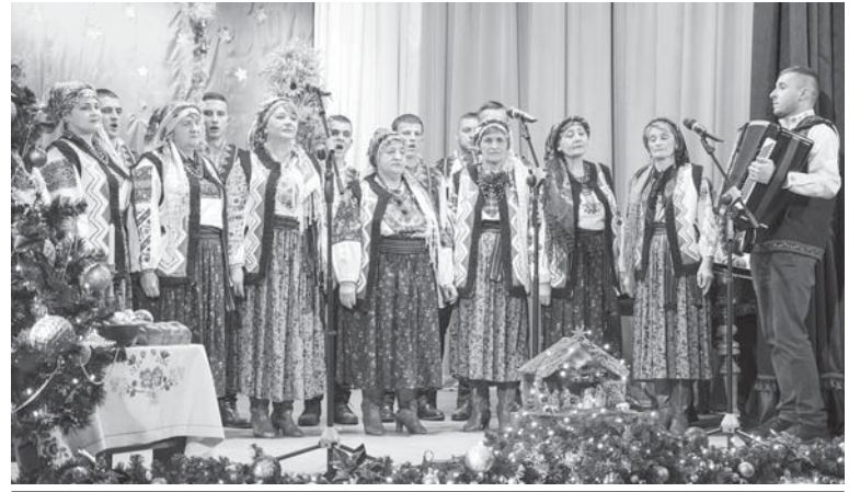
Фольклорний колектив «Острівчанка», с. Чорнолізці