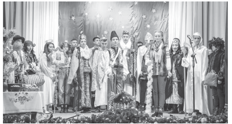
Вертепне дійство від юних драмгуртківців с. Клубівці