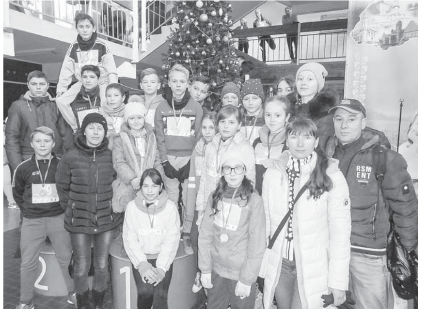
Команда Тисменицького району