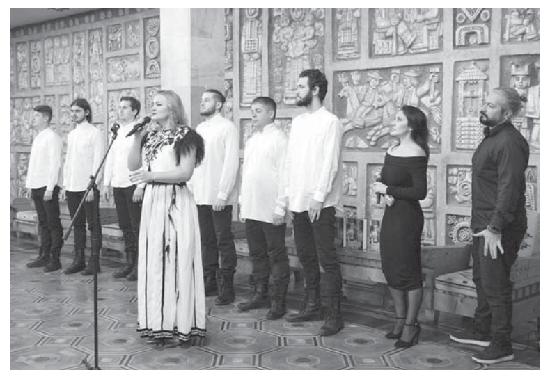
Літературно-музична композиція від театру

Щиро й емоційно виступила на презентації й Голова світової федерації лемківських об'єднань Ярослава Галик. Привітавши автора з виходом книжки, вона відзначила, що Світова федерація лемків високо цінує такі наукові праці. За її словами, Україні бракує системного, гідного дослідження тих процесів, які відбувалися і в міжвоєнний період, і в 1944-51 роках. А власне вони відображені в книжці «Лемківські долі».