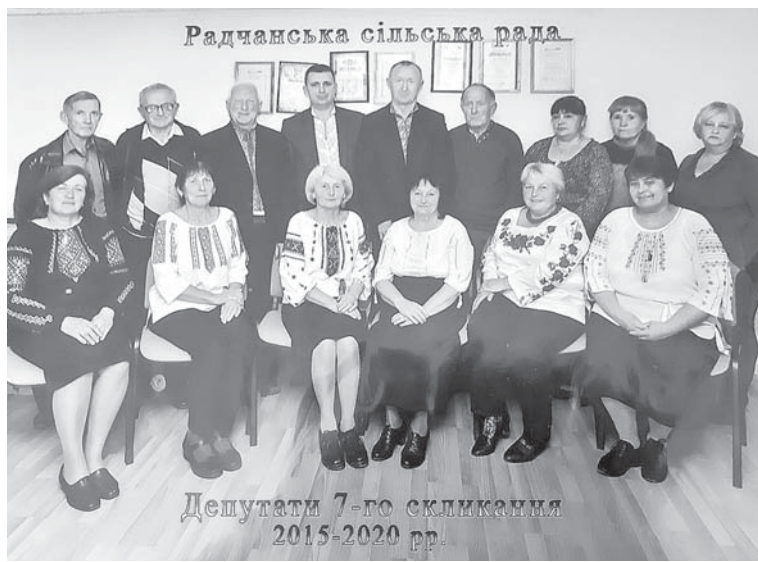
Депутати Радчанської сільської ради 7 скликання (2015-2020 рр.)

На поточний рік наш бюджет виконання складе орієнтовно 2 мільйони 800 тисяч гривень. Звичайно, буде й перевиконання на 110 відсотків від запланованих доходів. І це без офіційних трансфертів, тобто говорю про суто наші кошти. Від міста ми отримали 120 тисяч субвенції на облаштування прицерковної території – викладення її