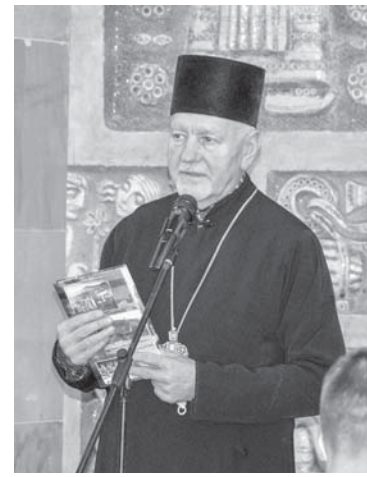
Благословляє учасників події митрополит Володимир Війтишин

«Лемки – найзахідніша етнографічна група українців Карпат, яка була тотально, до єдиної людини, вигнана з рідного краю. Віковичний ареал