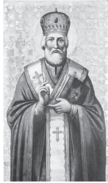
Ікона святого Миколая.