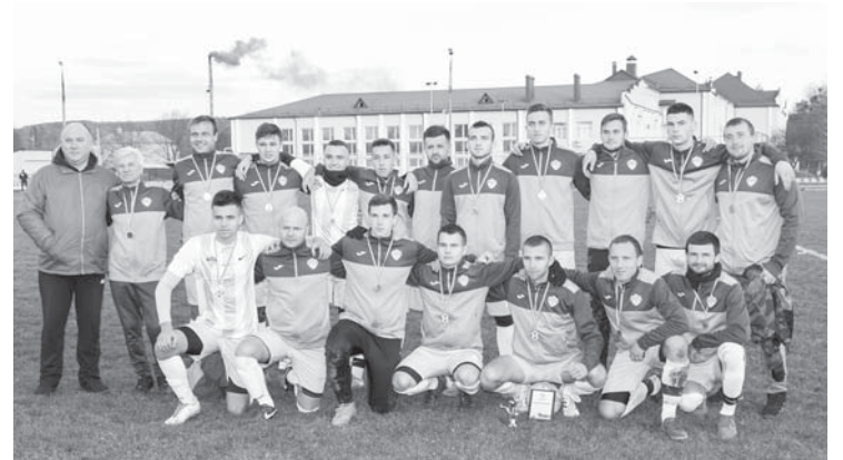
«Срібна команда» – ФК «Угринів»