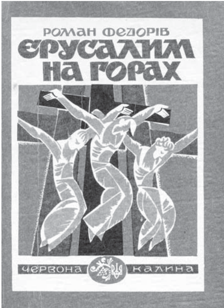
Перше видання роману «Єрусалим на горах» (Львів, Червона калина, 1993 р.)

не вмів писати, і я робив майже цілу газету (вона тоді виходила на одному листку). І як майбутній письменник здобув добру школу – їздив по селах, бачив людські долі, хоча, звичайно, писати мусив те, що вимагалось.