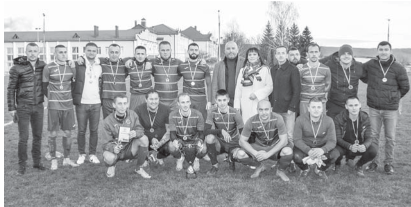
Переможець – «Авангард»