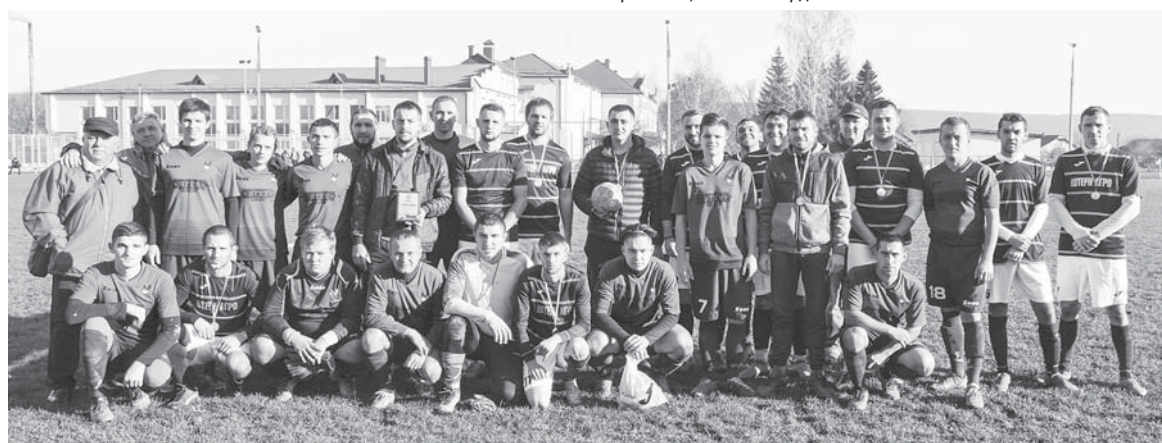
Футболісти угринівського «Сокола» та «Козацького острова»

Цікава статистика: за весь час проведення турніру (1968 – 1990 рр. з перервами; 2011 – 2019 рр. з перервами) команда Загвіздя чотири рази (найбільше) ставала володарем кубку газети «Вперед», і востаннє в 1988 році. Починаючи з 2011 року (крім 2014-го, коли турнір не проходив) так само чотири рази переможцем турніру ставала команда сусіднього Підлісся (востаннє – у 2019 р.) Відтак цього року команда Загвіздя стала переможцем уперше.