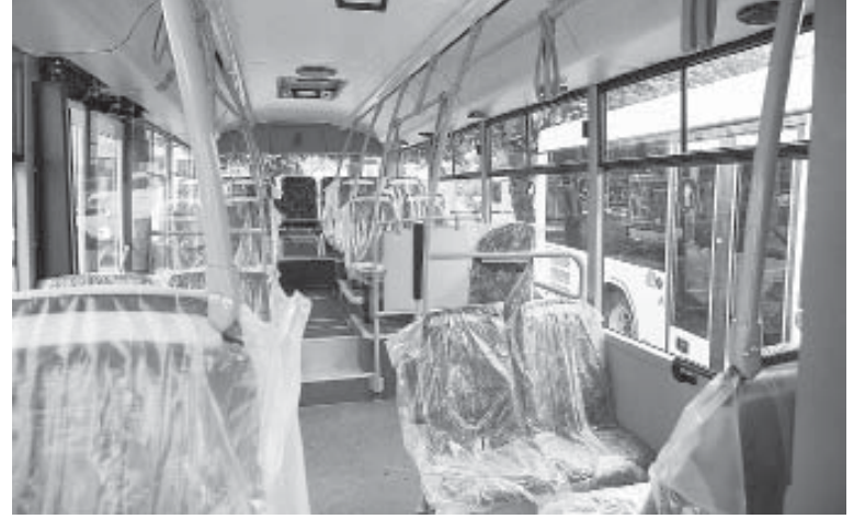
Новенькі автобуси – на жаль, міські, бо львівський «ЛАЗ» розтягнули

ди. Мер Франківська неодноразово заявляв, що весь громадський транспорт в місті врешті-решт мав би належати КП «Електроавтотранс» через те, що це «зручно, безпечно та соціально» і з ним не було б тих проблем, які є з приватними перевізниками.