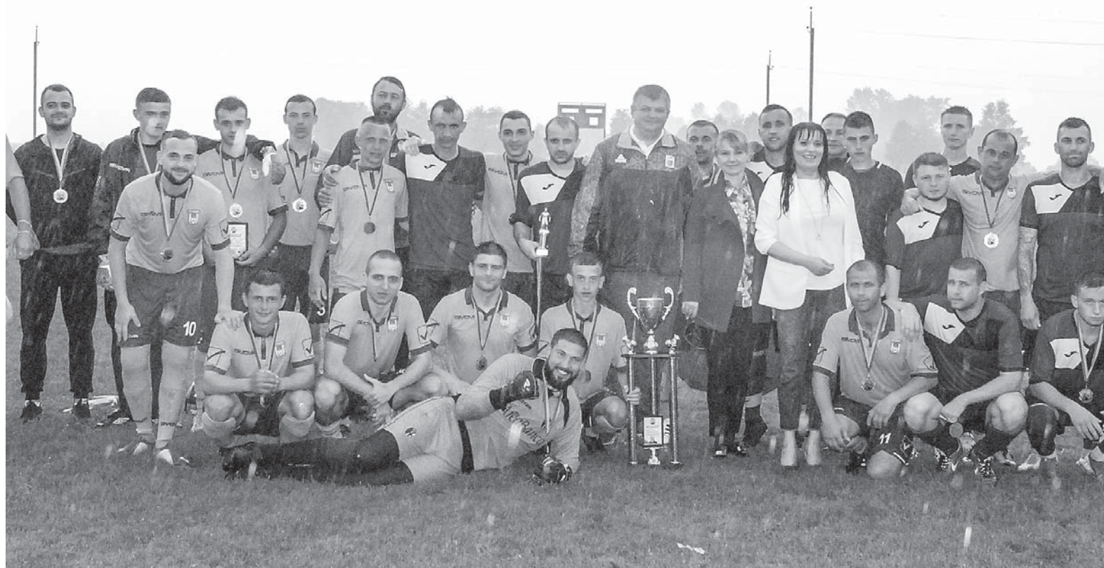
Віталій Федорів з футболістами-односельчанами під зливою. Червень 2020 р.

Як відомо, своїм указом від 5 листопада Президент України В. Зеленський звільнив з посади голови Івано-Франківської ОДА Віталія Федоріва. Незалежні прикарпатські аналітики вбачають в таких діях влади очевидний політичний мотив, пов'язаний із низьким відсотком голосів за «слуг народу», отриманим у нашому регіоні на місцевих виборах. Натомість претензії до ефективності Віталія Федоріва (напередодні прем'єр-міністр Д. Шмигаль у контексті погодження