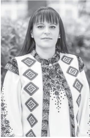
Міський голова Тисменицької об'єднаної територіальної громади Тетяна ГРАДЮК