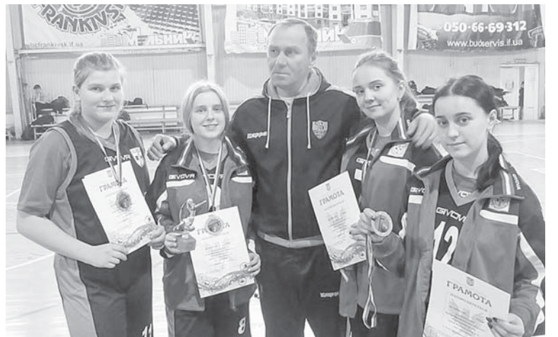
Баскетболістки – чемпіонки області