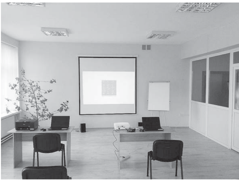
Кімната молодіжного інформаційного центру