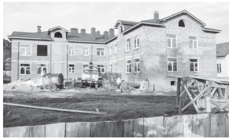
Новобудова Чорнолізького дитсадка

Така сама картінка з клубом у Пшеничниках – «ЗАВЕРШУЄМО...» А то нічого, що будівництво клубу – ініціатива і власний проект Пше-