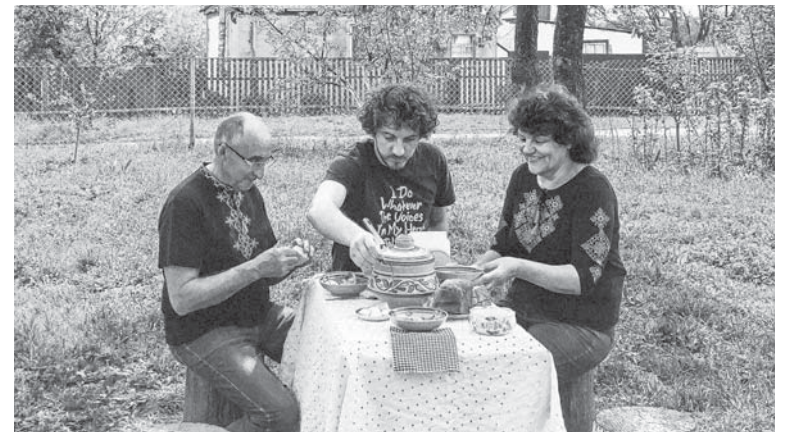
Борщ із батьком і мамою