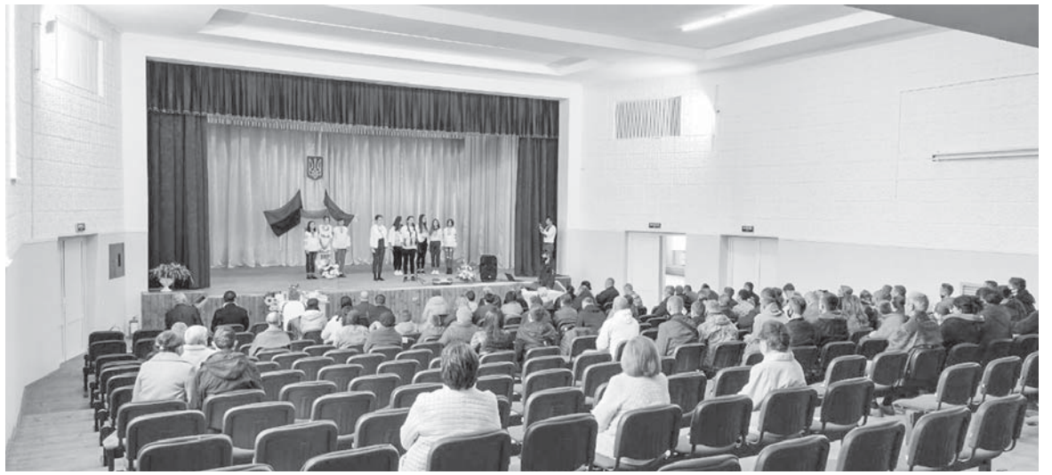
Концерт в новому залі

Власне кажучи, зал діяв і раніше – за часів «Союзу». Та після розвалу імперії фактично закrywся, занепав рівництво новоствореної Загвіздянської ОТГ. Відбувся капітальний ремонт, на який використали півтора