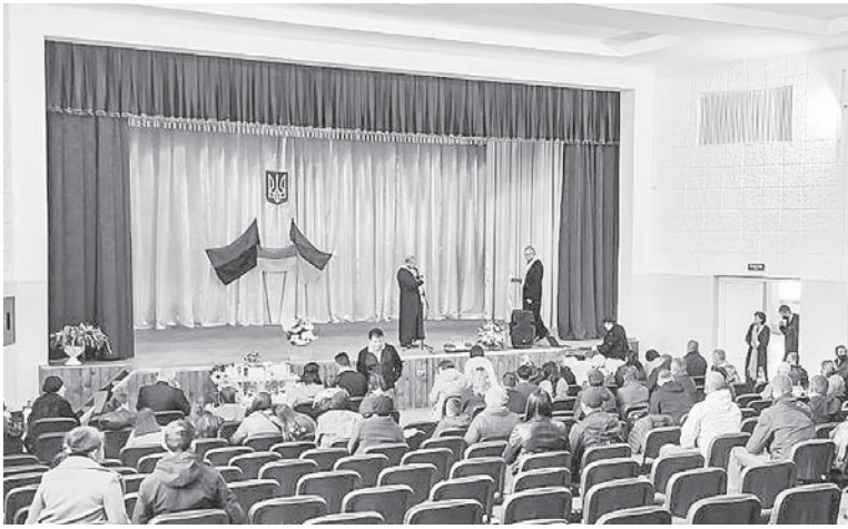
Відкриття й освячення залу

і став складським приміщенням й місцем, де займалися різною майстеркою. Двадцять років ніхто не брався до ремонту цієї «машини» (у радянський період зал вмiщав 450 глядачів і досі залишається найбільшим на території Тисменицького району), а тим часом тут прогнила підлога, приміщення перетворилося в руїну. Нарешті залом зайнялося ке-