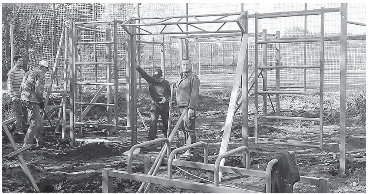
Монтується майданчик із тренажерами в с. Загвізді