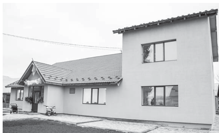
Дитячий садок «Сонечко» в Єзуполі: до реконструкції і після