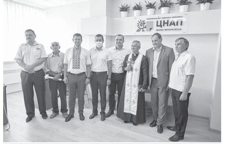
На відкритті ЦНАПу в Березівці...

лило на котельню, яка має забезпечити опаленням велику будівлю Соціально-культурного центру, включно зі спортзалом та ЦНАПом. Наразі ж в адмінцентр придбали дві електричні батареї, а в котельні ведуться будівельні роботи. Забезпечили кошти (150 тис. грн) і на ремонт у школі – за їх рахунок до початку цього навчального року поміняли стару дерев'яну підлогу на плитку на першому поверсі будівлі. Допомогло місто й місцевій церкві сумою у 100