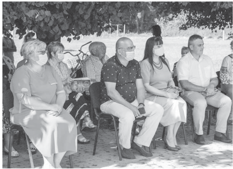
Місцева влада та гості