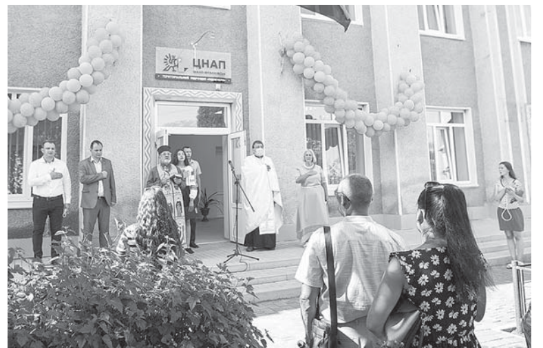
... і Підпечерах