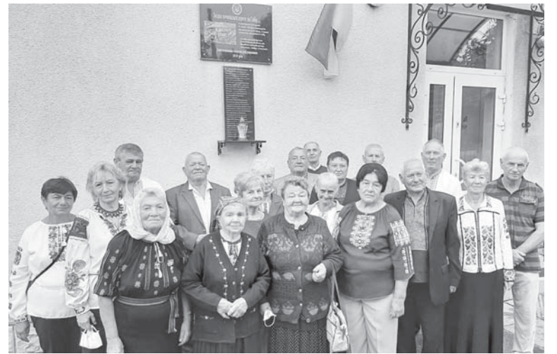
Фото на згадку учасників відкриття меморіальної дошки