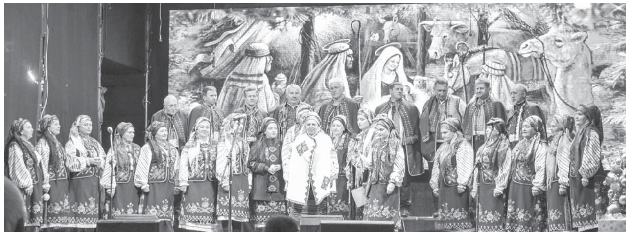
Підлузькі аматори сцени

Коляда, віншування, жарти лунали над Вічевим майданом і були винагороджені щирими оплесками.