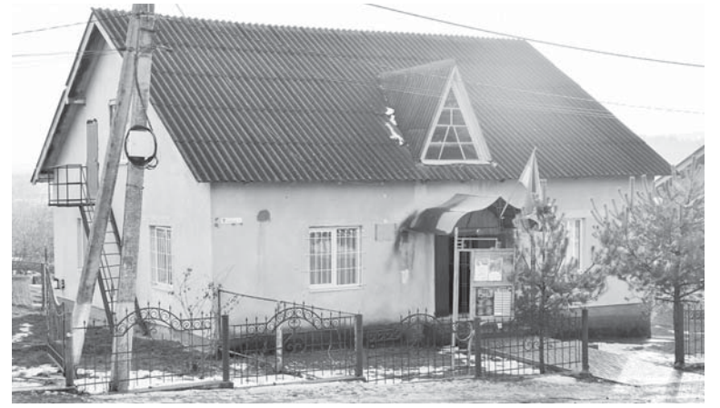
Адмінбудинок сільської ради с. Колодіївка

лось зреалізувати проект громади «Покращення медичних послуг у ФАПі с. Колодіївка – капітальний ремонт» за кошти Європейського Союзу, а також Програми розвитку ООН в Україні. Є загальноосвітня