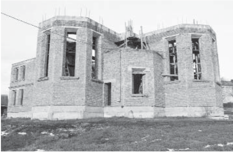
Стара церква Св. Михаїла, будується нова

школа І-ІІ ст. на 150 дітей, яка потребує ремонту, особливо перекриття даху, є будинок культури, на хорошому рівні і художня самодіяльність села. Можемо говорити і про те, що наша, колодіївська церква Святого Михаїла, побудована ще у 1865 році, є не тільки центром духовності села, а й належить до сакральної спадщини Прикарпаття. На сьогодні церква відреставрована, натомість є потреба для громади будівництва нової церкви. Таке будівництво триває, місце на спорудження нової церкви Св. Михаїла було посвячено ще у 2004 році. Принагідно хочеться висло-