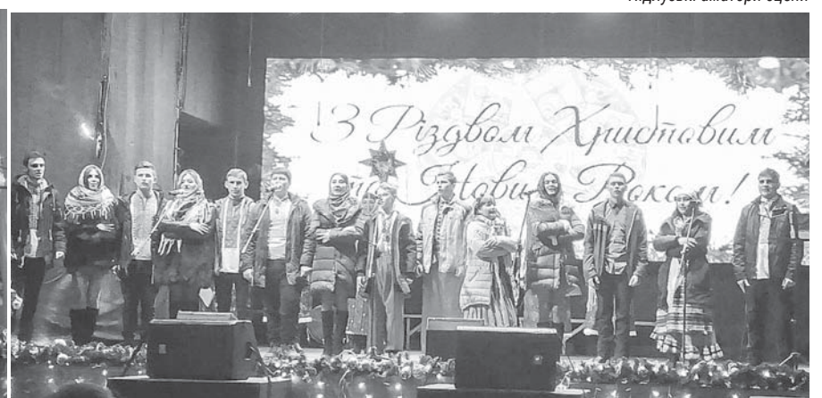
Узинський «Горицвіт» та юні продовжувачі традицій