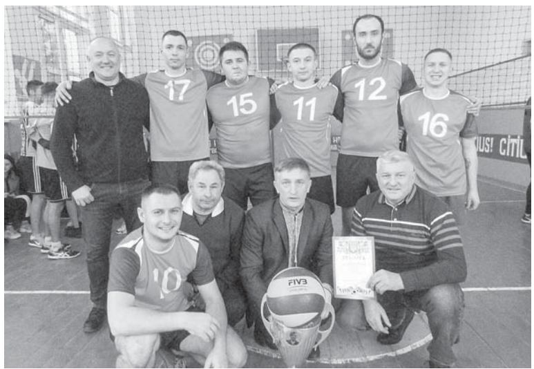
Переможці – команда з Рівного

тра Остап'юка (16.06.1988 – 29.05.2014), уродженця Торговиці, котрий загинув 29 травня 2014 року біля Слов'янська