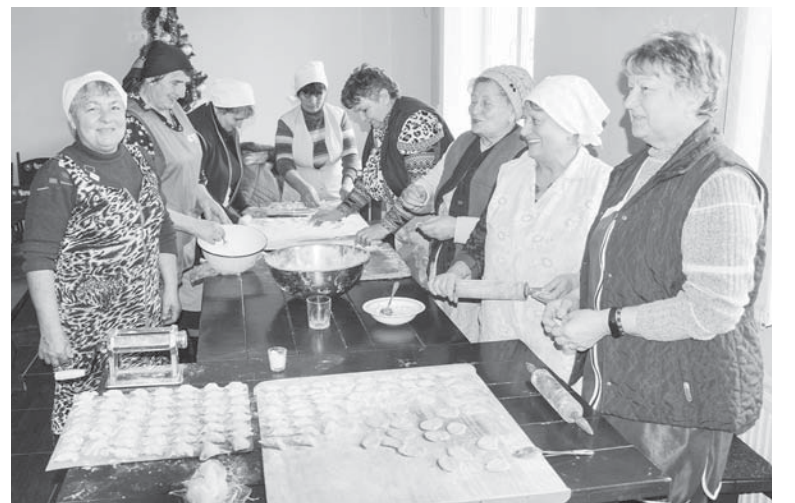
Хай будуть сильними в обороні держави – для воїнів ліплять вареники українські берегині з Колодіївки