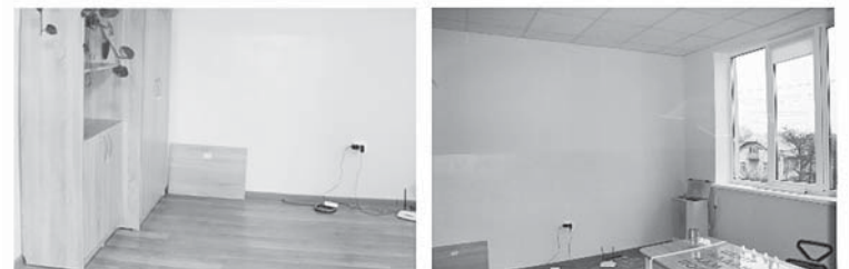
Тязів. Ремонт приміщення ЦНАПу та сільської ради

Загалом на розвиток спорту в ОТГ у 2019 році витрачено 2 971 000 грн.