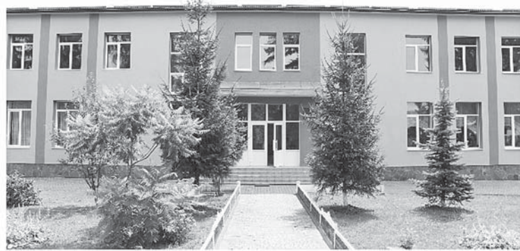
Сілець. Утеплення фасаду гімназії

120 000 грн виділено на фінансування футбольних команд сіл ОТГ. На фінансову підтримку громадської організації ФК "Вихор" Ямниця (учасника чемпіонату області) виділено 387 000 грн.