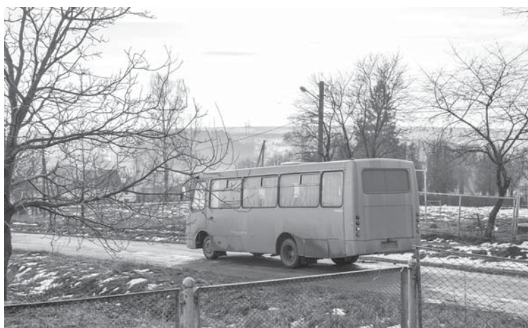
Сполучення з обласним центром – завдання з перших