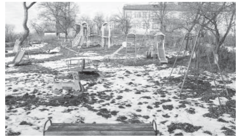
ЗОШ І-ІІ ст. – центр освітнього життя села, обабіч неї дитячий ігровий майданчик