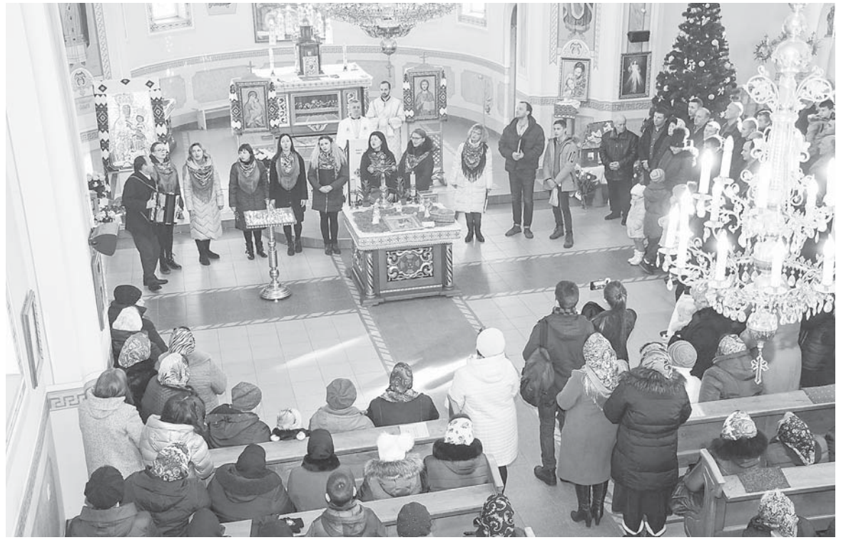
Музична школа № 1 в гостях у березівчан

— Наразі цим питанням ми ще не зайнялися, але будемо, безумовно, вивчати, і якщо виникне необхідність, подаватимемо його на розгляд у відповідні інстанції, щоб навести з землею лад чи налагодити співпрацю з орендаторами й землевласни-