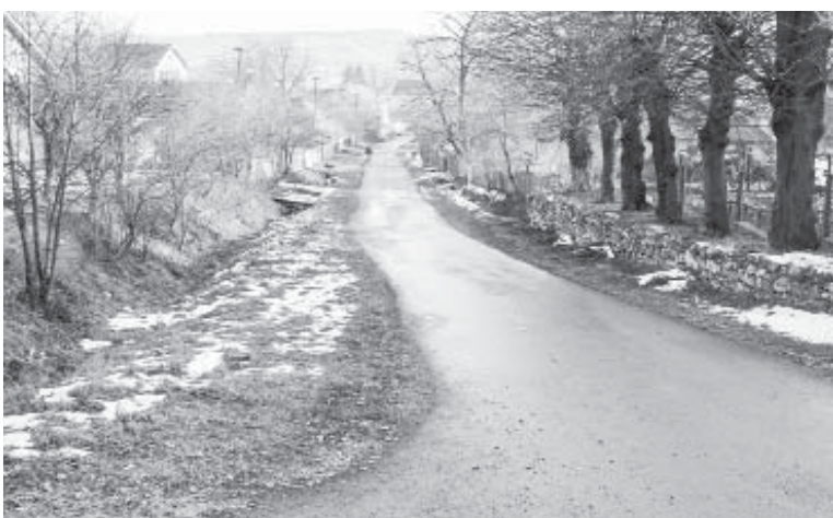
Якісно відремонтована дорога по вулиці Євгена Коновальця