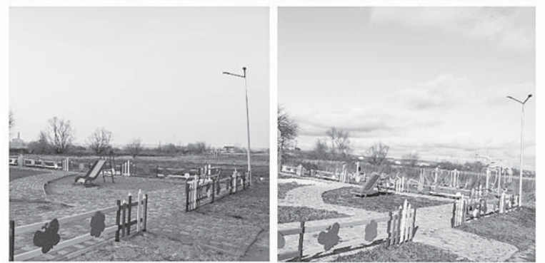
Ямниця. Тренажерний майданчик

послуг Ямницької ОТГ в рамках реалізації вирашного для громади проекту на створення та модернізацію ЦНАП від програми "U-LEAD з Європою".