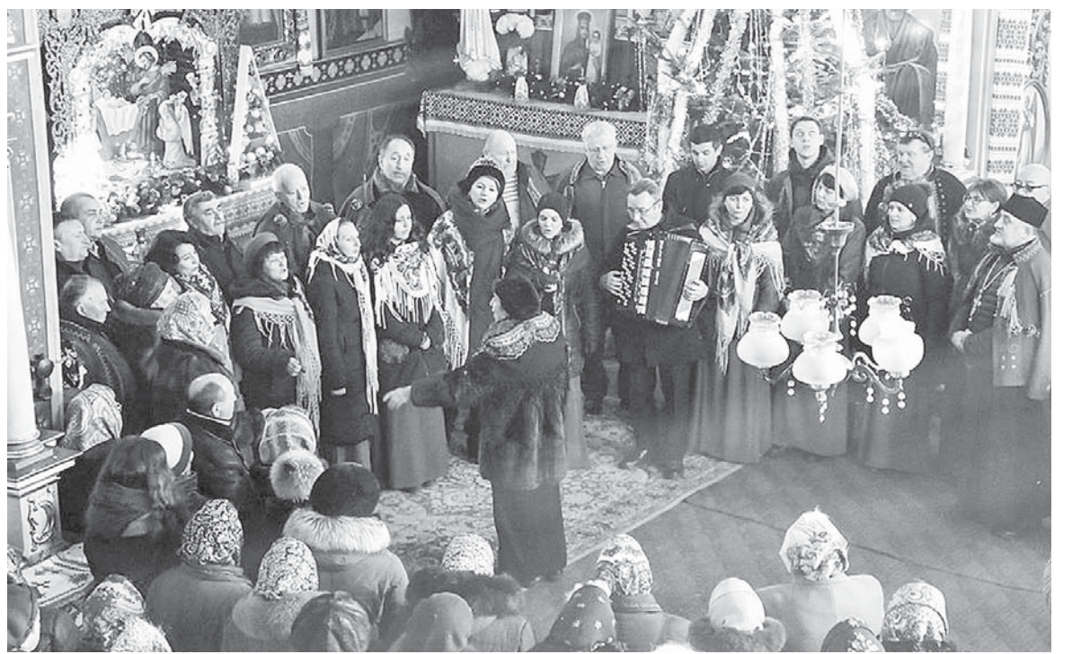
Франківці колядують разом з Підпечерами