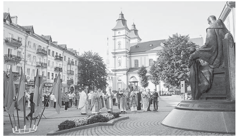
Поминальна молитва на площі Шептицького

Як зазначено в історичній довідці Івано-Франківської архієпархії на її офіційній інтернет-сторінці, «третім Станіславівським єпископом став