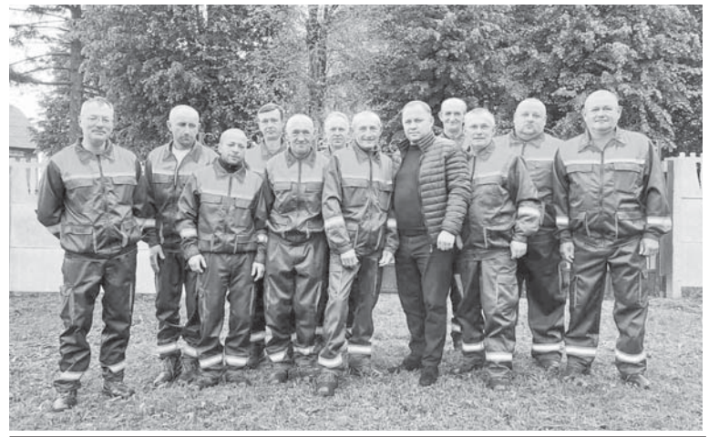
Колектив КП «Ямниця»

Отож, щодня працівники підприємства мають роботу, чітко розроблені керівництвом плани. «Зараз, – розповідає Р. Савуляк, – з шести осіб, які працювали від заснування КП «Ямниця», є четверо чоловік. Середня зарплата була 4 тис. гри-