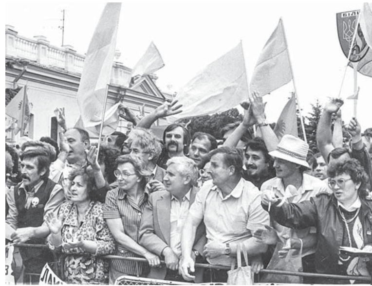
Під стінами Верховної Ради. 1990 р.

Насправді прийняття цього документу було неймовірною перемогою. Варто пригадати, як виглядала політична ситуація. Щоб протистояти комуністичній більшості, представники демократичних партій і організацій утворили у республіканському парламенті опозиційну структуру – спочатку демблок, а потім – Народну раду на чолі з