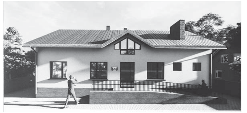
За проектом так буде виглядати майбутнє приміщення КП «Ямниця»

Що стосується самого комунального підприємства, то ми наразі не маємо свого приміщення, займаємо невеликий кабінет в приміщенні сільської ради і підвальне приміщення, де бракує належних умов для персоналу. На даний час виготовлено проект будівництва власного приміщення по вулиці Степана Бандери в Ямниці, де ко-