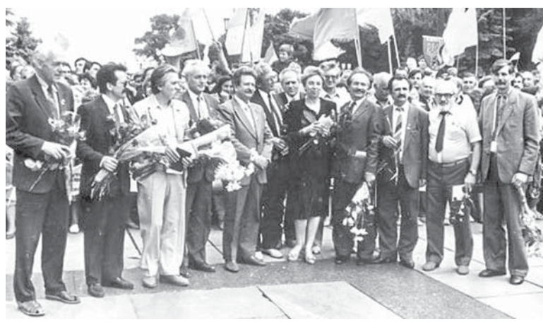
1990 р. Демблок

Усе це ніяк не суміщалося з укладенням союзного договору, про який ішлося в прикінцевому положенні Декларації і на який розраховувало керівництво імперії. Прийняття подібних документів також іншими республіками засвідчило, що «Союз нерушимих» валиться остаточно. Але – і в цьому можемо не сумніватися – незалежність саме України стала вирішальним фактором для кінця СРСР.