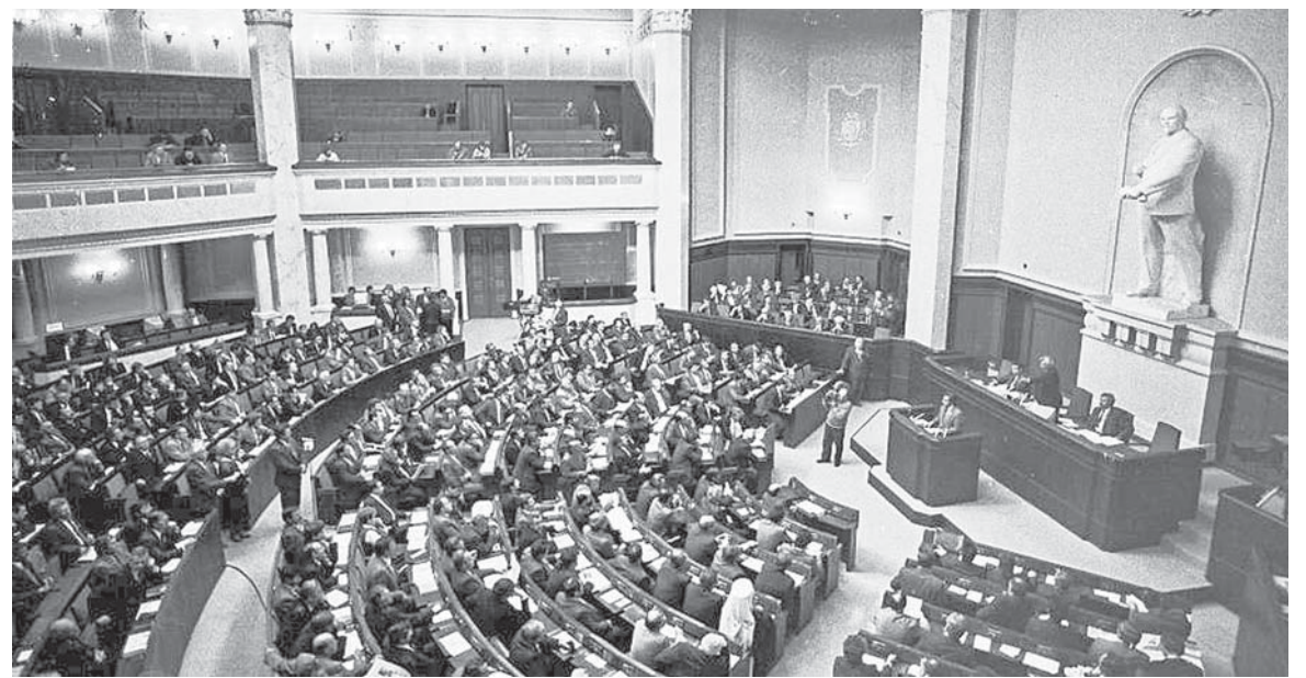
У залі Верховної Ради

ційно об'єдналась і комуністична депутатська більшість. До групи «За Радянську суверенну Україну» увійшло 239 депутатів (у народі відома як «група 239»), очолені Олександром Морозом.