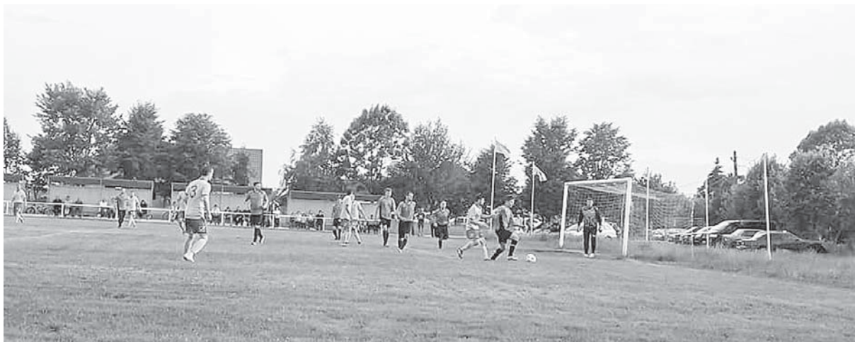
Під час гри «Колоса» з липівчанами що завершилася результатом 2-0 на користь Братківців

Примітка: з повним текстом рішення можна ознайомитися у Старолісецькій сільській раді за адресою: с. Старий Лисець, вул. Івана Франка, 1.