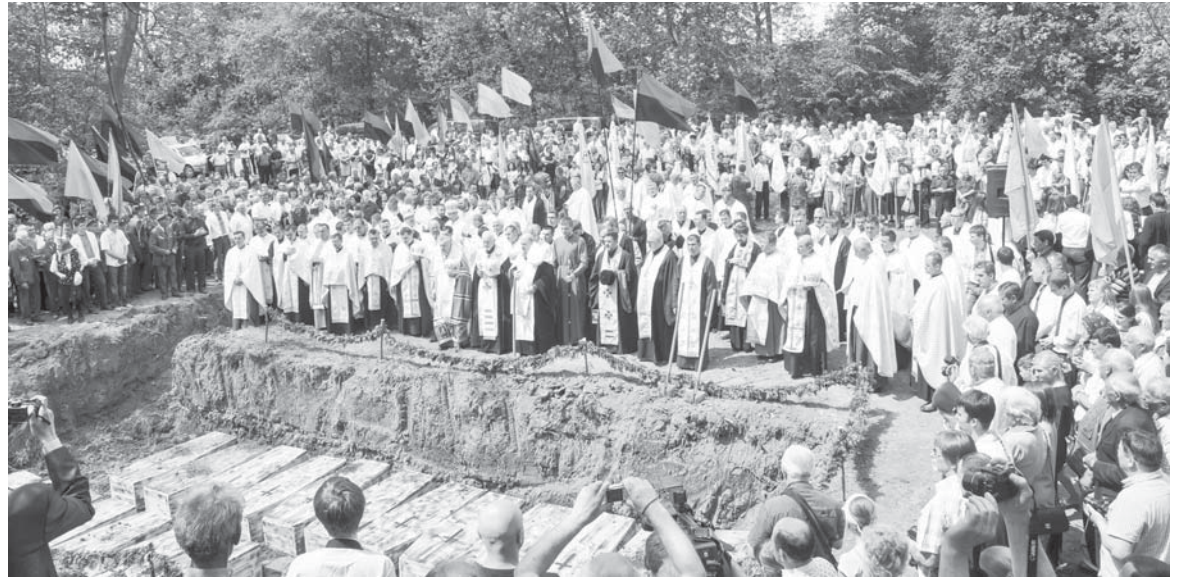
"Перепховання 9 травня 2013 р.