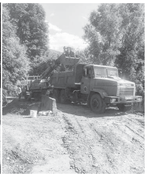
Завершується відновлення моста на вул. Миру

вому березі Бистриці Солотвинської та збудувати дамбу на потічку в Угринові на масиві Довга Нива і тут же зробити дощові водовідведення. Усе це затратні великі роботи, які, однак, мають нас убезпечити від подібних повеней у майбутньому».