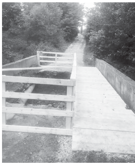
Монтують міст на Симоненка

На сьогодні відновили пішохідний перехід – дерев'яний міст – на вул. Симоненка, проїзд по вул. Миру, підняли та змонтували перехід на вул. Квітковій. «Працюємо з відновленням гравійно-піщаного покриття в Клузові. А попереду нас чекають ще масштабніші роботи, – говорить заступник голови ОТГ. – Необхідно збудувати новий міст на вул. Симоненка – це вже будівництво, яке потребує проєктної документації. Вестимуться руслоочисні роботи на потічку через територію Угринова. Необхідно втілити вже розроблений проєкт реконструкції дамби – першої черги – у Клузові на лі-