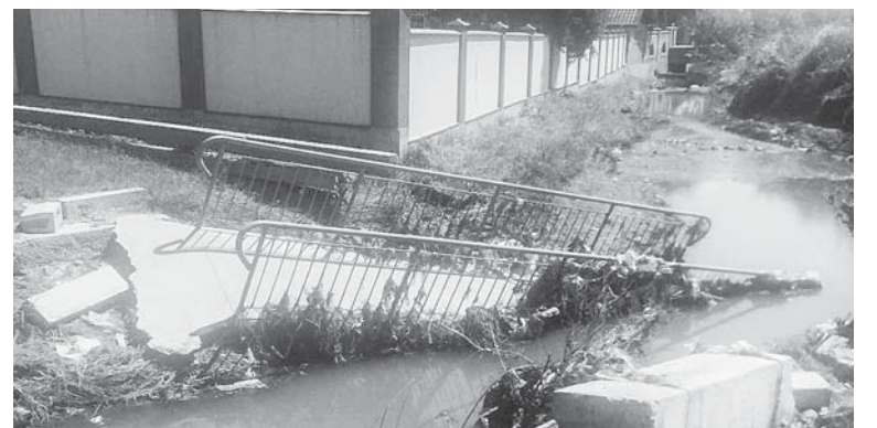
Зруйнований мостик на вул. Квітковій