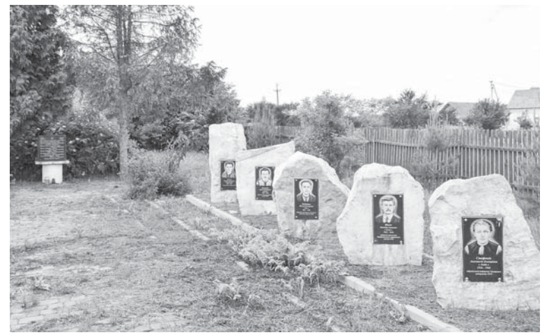
Меморіальний сквер героям УПА та ОУН