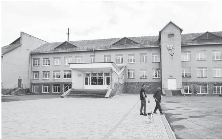
Школа, що стане ліцеєм

ків у нас буде тринадцятеро. Загалом старшокласників матимемо понад 25. Тобто учнів достатньо для статусу ліцею». У старші класи ходять сюди діти і з Березівки, де школа має лише І-ІІ ступені.