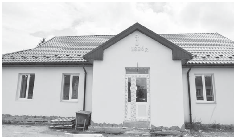
Колишня резиденція — майбутній НВК

Наша поїздка Братківцями охопила ще не один об'єкт. Направду,