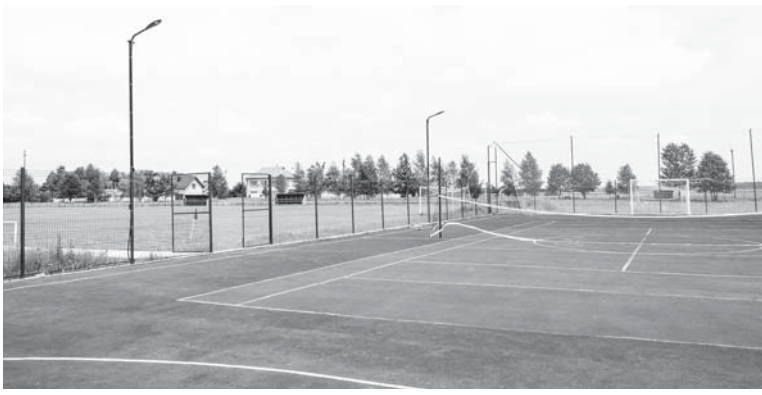
Поруч стадіону майданчик для міні-футболу зі штучним покриттям