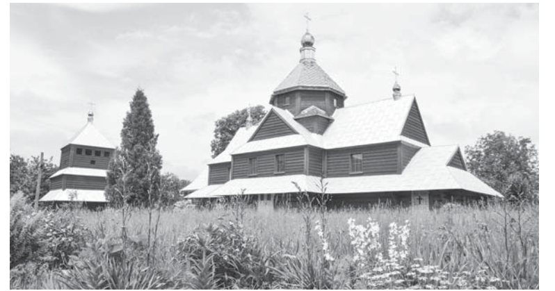
Стара церква Преподобної Параскеви

села діє підприємство, що займається дробленням каменю на різну фракцію, виготовленням бетонних блоків, має пилораму. Є крамниці. Місцеві підприємці роблять внесок у творення бюджету села, що складає цьогогоріч 1 млн. 840 тисяч грн. Що ж до населення і дворів, то окрім зареєстрованих тут, понад 2,5 тисячі дворів на території Братківців складають дачні угіддя на 26 гектарах землі. Як зауважує в.о. старости Н. Рибак – «вони наче й братківецькі, а наче й ні...»