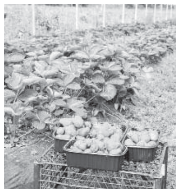
Розкішні куці суниці садової у ФГ «Беррі Прикарпаття»