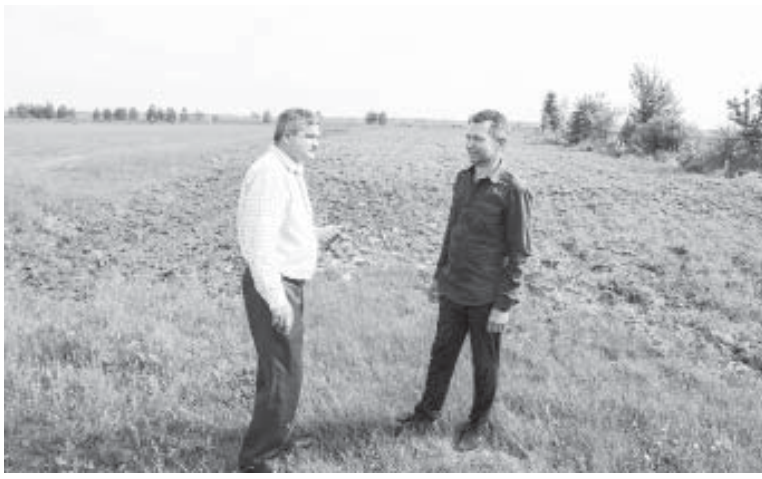
Сільський голова Чукалівки та голова фермерського господарства «Беррі Прикарпаття»

важливо, щоб і дощ не падав і була провітрюваність. Тому рослини знаходяться тут під легким покриттям. Фермер розповідає, що на перших порах за ремонтентними сортами суниці садової (плодоносять, починаючи з весни, шість місяців) їздив в Італію. Там закупив розсаду, сорти «Мурано», «СвітЕнн». Урожайність, як стверджує, 40 тонн з гектара. На сьогодні фермер вже навчився сам вирощувати розсаду. Загалом у господарстві задіяно вісім сезонних робітників. Отже, створені до-