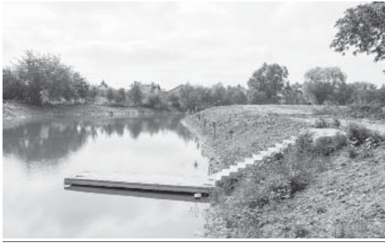
Русло водойми капітально очищено

Зрозуміло, виграні проекти приносять додаткові кошти. Смачною красою можна назвати господарство «Беррі Прикарпаття», що відразу за селом. У ІХ обласному конкурсі проектів та програм розвитку місцевого самоврядування 2018 року Чукалівська сільська рада стала переможцем з проектом «Вирощування плодово-ягідних культур за інтенсивною технологією». Погодьтеся, 300 тисяч гривень з обласного бюджету завдяки виграному проекту – це вже успіх, як для села Чукалівка, так і для фермерського господарства «Беррі Прикарпаття». Схоперовані кошти, 300 тисяч – область, 20 – район, 10 – сільська рада, спрямовані на закупівлю теплиць. На сьогодні «Беррі Прикарпаття» – це рівні рядки (0,25 гектара) з великими уже червоними ягодами полуниці. Ще 36 сотих землі, які фермер орендує, ділянка між кладовищем і стадіоном. І саме ця територія підготовлена під встановлення теплиць. На даний час у господарстві фермера є теплиці, зведені за його власним коштом, а за отримані від проекту постануть тут згодом. Голова фермерського господарства п. Богдан Лутчин пояснює, що у вирощуванні полуниці, – як ми її звикле називаємо, а більш точна назва «суниця садова», – дуже