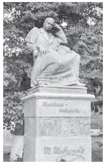
Пам'ятник Т. Шевченкові в Єзуполі