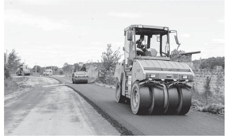
22 травня. Компанія ПБС почала прокладати дорогу в Братківцях

Спілкувався та підготував Володимир ЗАНИК