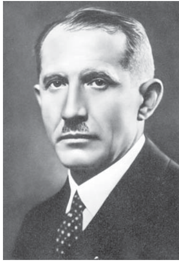
Євген Коновалець. 30-і роки

Однак вже наступного року рішенням українського керівництва регулярні військові частини були розформовані. І знову потрапив у табір. А звільнившись з ув'язнення, перебрався в Чехо-Словаччину. Тут намагався організувати з інтернованих бійців УГА, а також українських полонених з таборів у Італії військово-формування та робив спроби організувати збройне підпілля на окупованих українських землях.