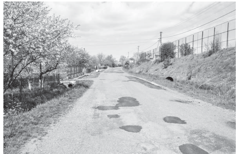
Вулиця Незалежності після ямкового ремонту