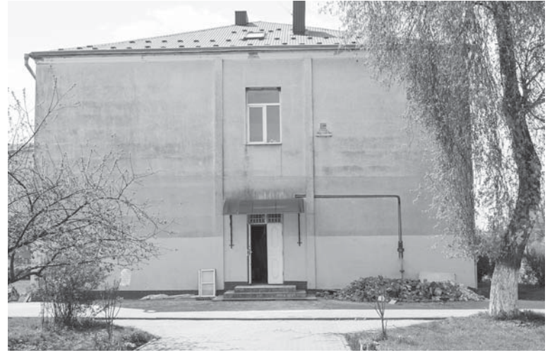
Старий корпус ліцею невдовзі стане новим

«Думаємо, що угринівські випускники покажуть гідні результати. –