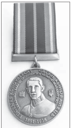
Пам'ятна медаль Євгена Коновальця. Литва 2018

го народження в Галичині. Коновальцю довелося терміново звернутися до литовського уряду, адже впродовж десятиденного терміну мав би покинути Швейцарію. Завдяки литовському втручання, проблему вирішують... Однак життя, як сам казав, «наче бездомного бурлаки», позначалося і на здоров'ї, і на моральному стані. А в 1935-му знову загроза