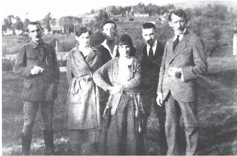
З друзями у Ворохті (крайній праворуч)

А в березні 1932-го з подачі поляків його викликає швейцарська поліція