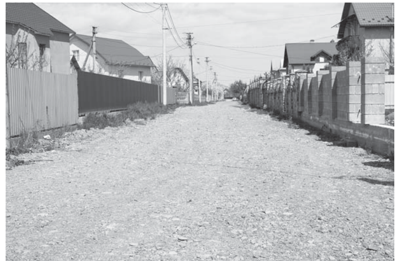
Після «вирівнювання гравійною сумішшю»