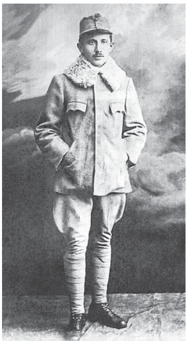
У російському полоні

За матеріалами інтернетвидань, зокрема, istpravda.com.ua/ Підготувала Вероніка ЗАНІК