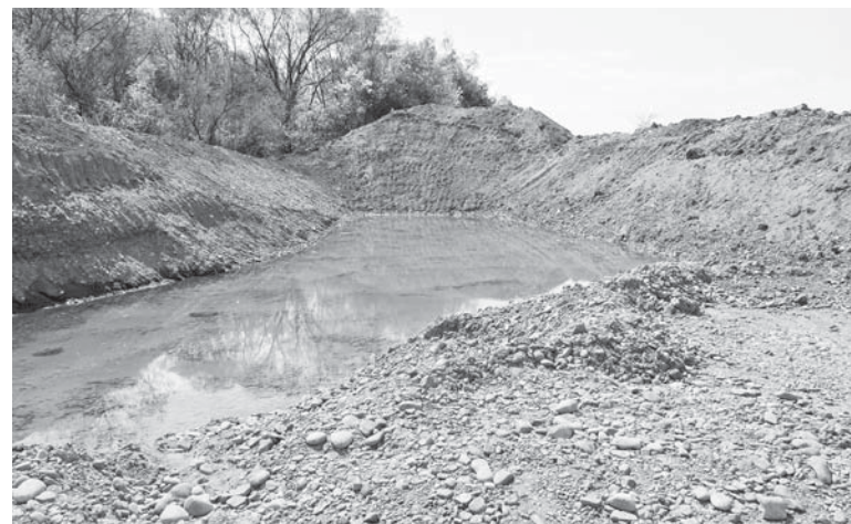
Технічна водойма в Клузові

відпочинкове місце. А третю функцію створення водойми вже, можна сказати, виконано. Сотні кубометрів викопаного гравію дорожники використали для, скористаємось їхньою термінологією «вирівнювання профілю дороги гравійною сумішшю», і таким чином більшість клузівських вулиць вкатали штуром, підготувавши основу для асфальтування чи бруківки в майбутньому. Не на бетоносуміші використали, а на вирівнювання доріг. За словами Чечіля, таким спо-