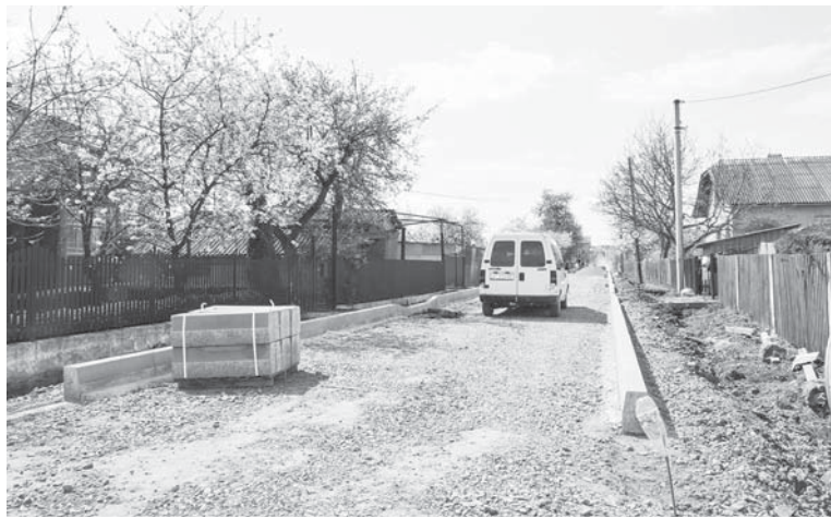
Вулиця Вишнева буде в бруківці

ремонт дорожнього полотна, а кілька вулиць будуть викладені бруком. Де нема каналізації – наразі вирівнюють гравій-