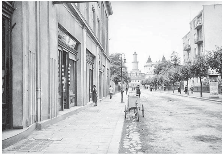
Вид на ратушу 30-ті роки 20 ст.

Щороку обласний центр відзначає свої «уродини» 7 травня, оскільки саме в цей день, на думку істориків, 1662 року Станиславів, як він тоді називався, отримав певні міські привілеї. Через рік польський король підтверджує їх так званім маґдебурзьким правом – містові на-