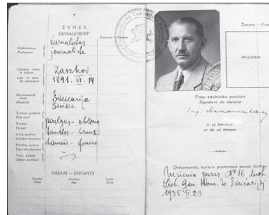
Литовський паспорт Євгена Коновальця

Литовці беруть пам'ять про Євгена Коновальця і в нинішні часи. Так, 2012 р. у місті Каунасі на будинку по алеї Свободи, у якому часто бував Конова-