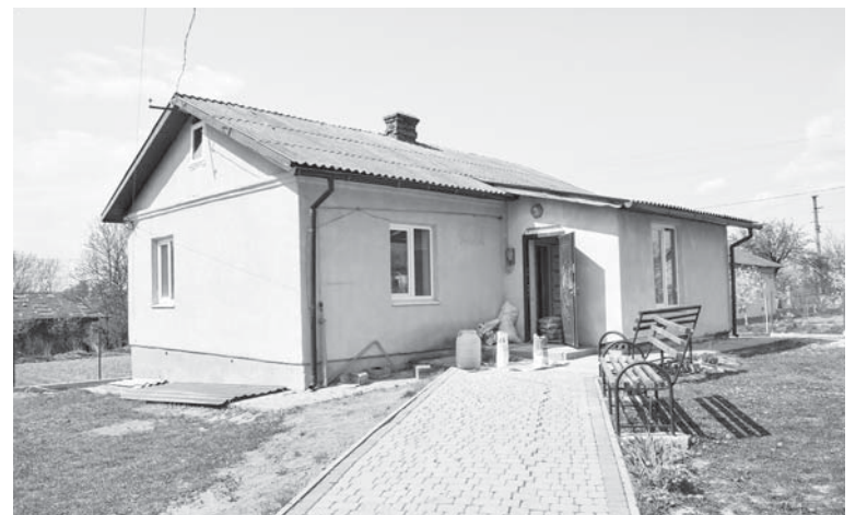
Майбутній дитячий садок