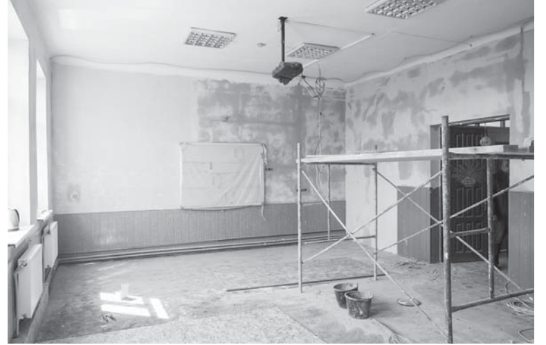
Капітальний ремонт початкових класів