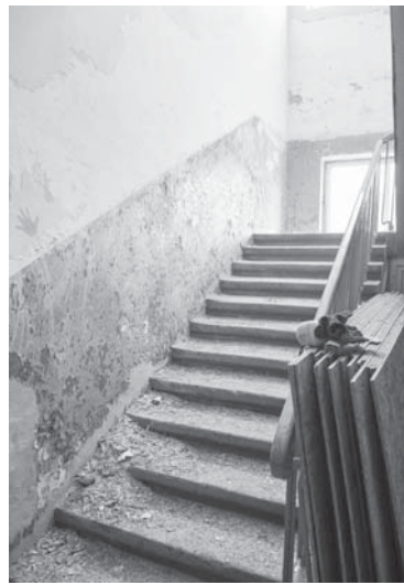
Ремонт сходової клітки

каже керівник ліцею. – Цьогорічний 11-й клас хороший, сильний. Так, завершення складне, але, з іншого боку, цьогорічні випускники, як ніколи, могли зосередитися на тих предметах, які винесені в них на ЗНО. Ма-