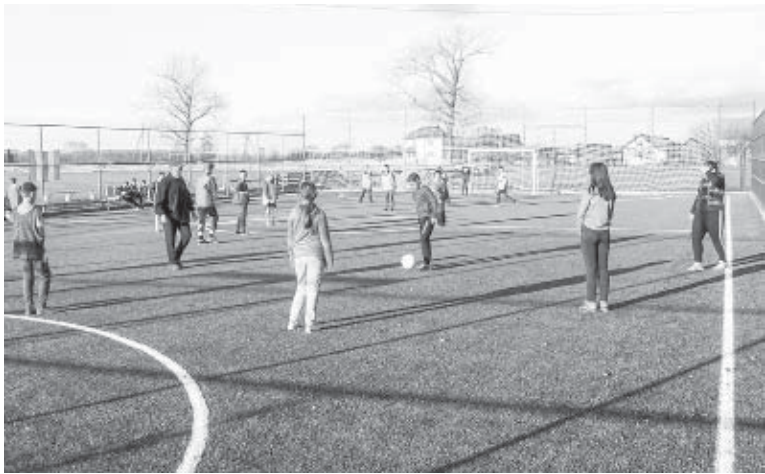
На новому спортмайданчику в Радчі копати м'яч люблять не лиш хлопці, а й дівчата

підписаних з Івано-Франківськом угод про співпрацю. Руслан Марцінків називав відкриття маршрутів кроком на шляху до об'єднання в міську територіальну громаду, що згодом і сталося.