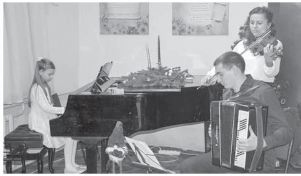
«Нова радість стала» у виконанні інструментального тріо