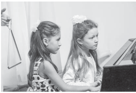
Лунає «Свята ніч»