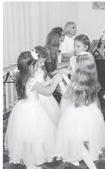
Тихо падає сніг