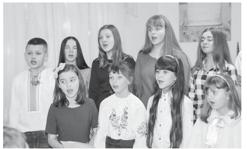
Вокальний ансамбль учнів музичної школи