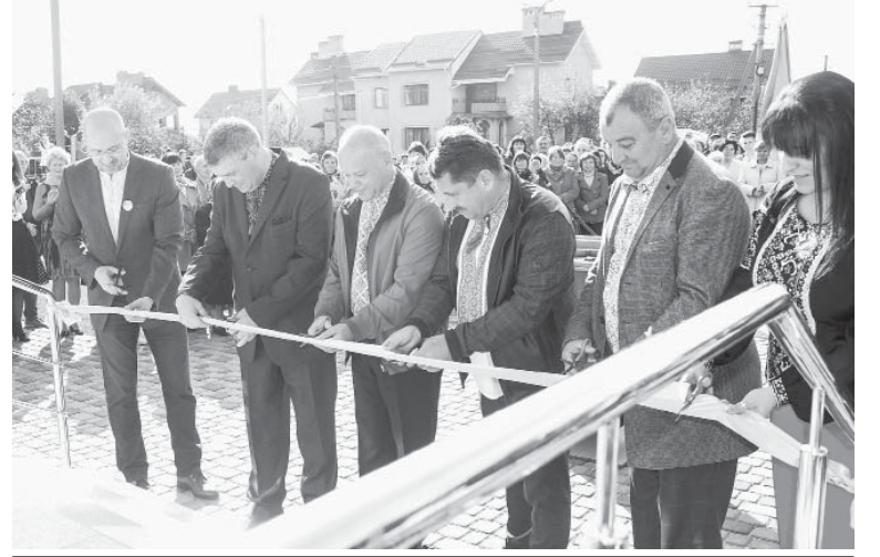
Відкриття амбулаторії в Угринові

діївка, Підпечери і Березівка. Рішення про їхнє добровільне приєднання до ОТГ міста міськрада прийняла 18 грудня. Таким чином, на кінець року до складу Івано-Франківської ОТГ увійшло вже п'ять сіл Тисменицького району. Непоганий