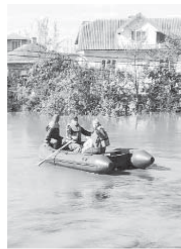
У Тисмениці розлилася Ворона

І насамкінець – про погоду. Весна і початок літа цього року видалися дощовими, і Тисменицький район трохи підтоплювало. 2-3 травня у Березівці вода мало не змила насип, у Тисмениці р. Ворона вийшла з берегів, а в Ямниці розлилася р. Павлівка.