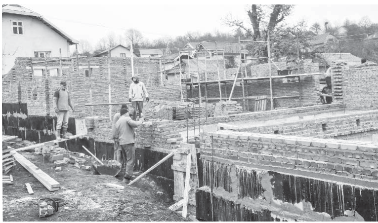
У Пшеничниках будують клуб

15 вересня відкрито дитячий садок «Мрія» в Чернівці, що розрахований на 100 дітей. Тут є ігрові кімнати для чотирьох груп, актовий і спортивний зали, санвузол, харчоблок, сучасна котельня, ігровий майданчик у дворі. Завдяки відкриттю садка створено 34 робочі місця.