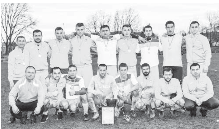
Учетверте володарі кубка «Впереду» – «Сокіл» Підлісся

Крім того, ми писали про те, що в Чукалівці триває будівництво школи, точніше НВК, а в Пшеничниках почали будувати клуб.