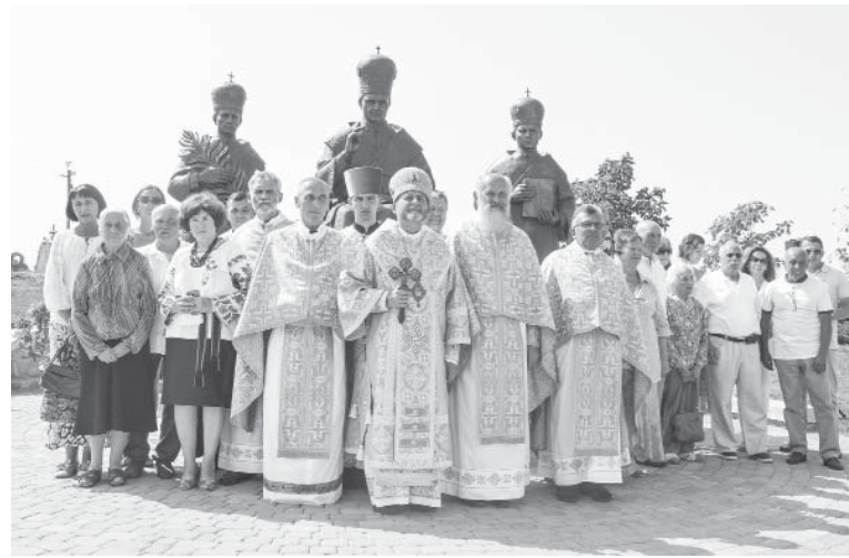
На відкритті пам'ятників у Погоні

7 серпня громада Клубівців зустрічала учасників доволі небуденної акції – міжнародної пішої прощі, які йшли із Самбора до Зарваниці. 268 паломників з дев'яти областей, віком від 7 до 82 років. Заробітчани або родичі заробітчани, змушених працювати у багатьох країнах світу. В селі їм виділили спортзал для відпочинку, нагодували смачним обідом та показали фільм про Прощу мігрантів 2012 року, учас-