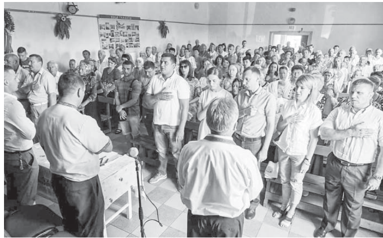
Схід села Чернівця, який проголосував за об'єднання з Франківськом

до закінчення періоду зимових свят, коли добропорядні галичани ще, як вважається, нічого не роблять.