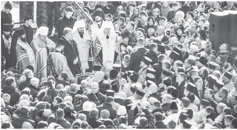
Петро Порошенко у Манявському скиті

І хоча в другому турі 21 квітня у тисменицькому окрузі виборці віддали за Порошенка більше голосів, ніж за Зеленського – 22238 проти 19700, загалом по Україні 73% виборців проголосували за політичного неопіта. Вступаючи на посаду президента 20 травня, Володимир Зеленський в інавгураційній промові заявив, що розпускає Верховну