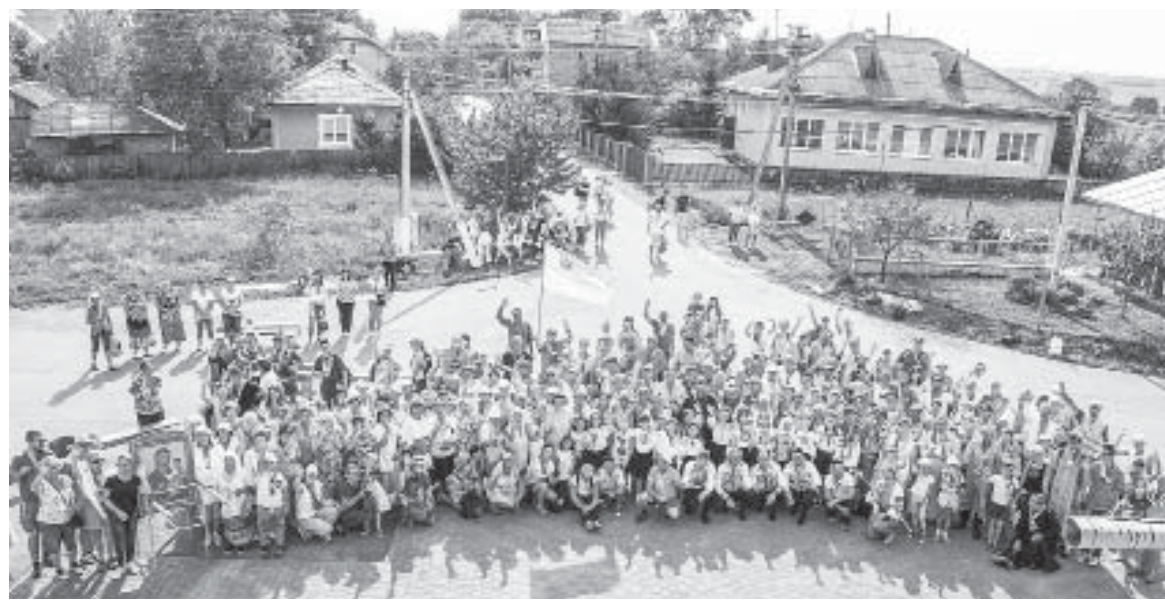
Міжнародна піша проща – у Клубівцях